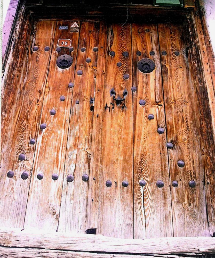
Tokat'ta toplumsal cinsiyetin kapı üzerinde sembolleştiği "üç tokmaklı kapı" örneği