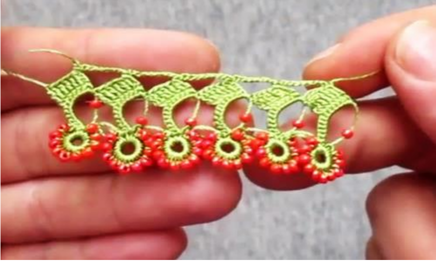
Tokat'ta "Celal Bayar gözlüğü" adı verilen oya örneği