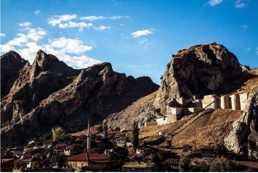
Tokat Kalesindeki insan silüetinden bir görünüm