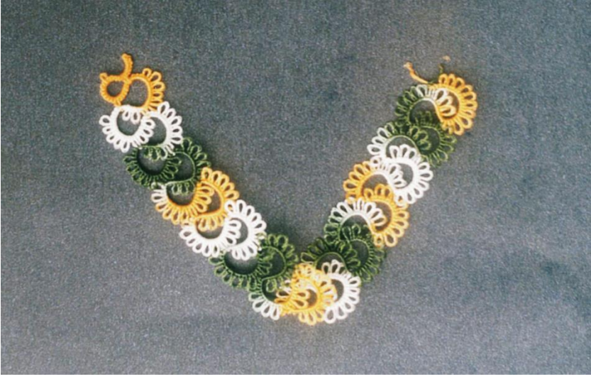
Tokatt'a "elti eltiye küstü" adı verilen oya örneđi