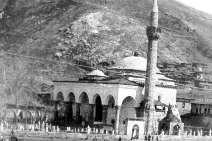
Tokat Hatuniye (Meydan) Camisi ve avlusundaki mezarlar, Tokat