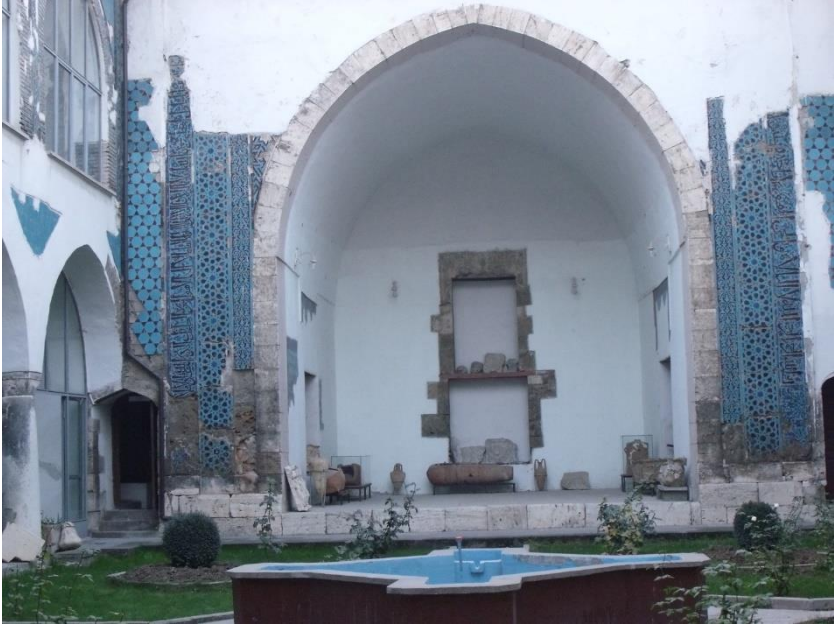
Tokat Gökmedrese (Kırkkızlar Darüşşifası) ve medresede yer alan Kırkkızlar türbesinden görünüm