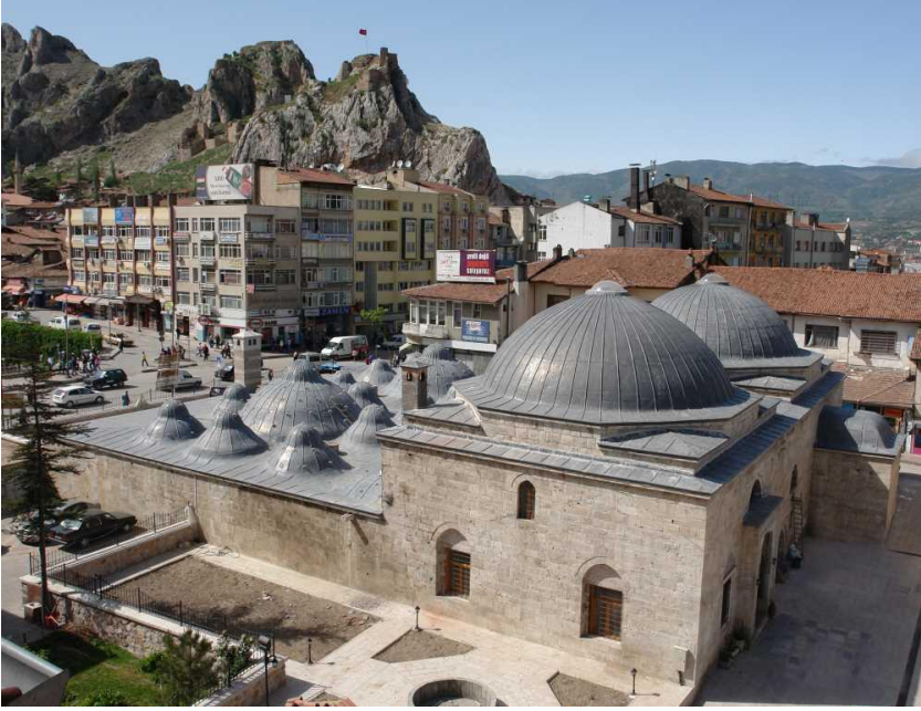
Tokat Ali Paşa hamamından görünüm