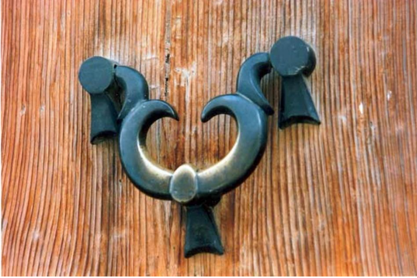
Tokat' ta dokumacılığın sembolü olarak şehir efsanesine dönüşen "eli belinde kilim motifli" kapı tokmağı örneği