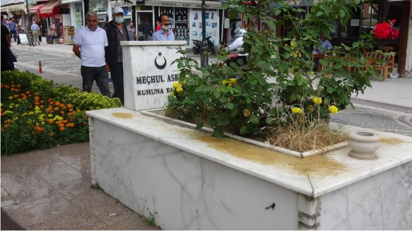
Tokat'ta kabrinin kaldırılmasına izin vermeyen meçhul askere ait kabirden görünüm