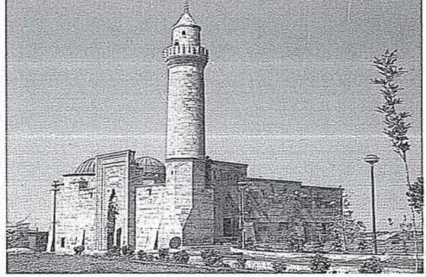
Niğde Alaaddin Camii

Türklerin yüksek ahlak, seciye ve insanlık vasıfları hakkında, Avrupalı seyyah ve elçilerin, değişik tarihlerde yaptıkları tasvirler, verilen örnekler o kadar hayranlık ve hatta hayret uyandırıcıdır ki, tarihini bilmeyenler, ecdadını tanımayanlar için bunlar mübala-