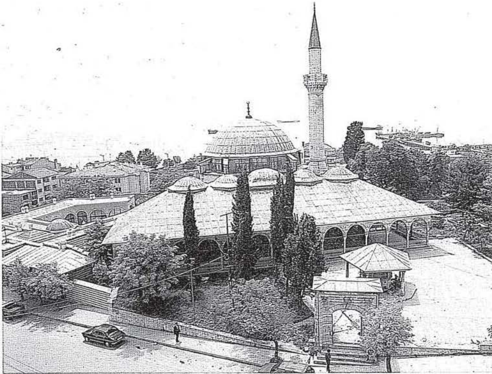
Tekirdağ Rüstem Paşa Camii

ğalı gelebilir. Bu tasvirlerin bir hülâsası yapılırsa, Türklerin asla yalan söylemedikleri, kimseyi aldatmadıkları, ticarete meşru haddi geçen bir kâra tenezzül etmedikleri, insanlık, şefkat ve yardımlaşma duygularını yabancılarından da esirgemedikleri görülür. Esasen, bu konuda millî kaynaklarımız, arşivlerimiz ve kütüphanelerimiz, Türk'ün bu yüksek vasıf ve seciyesini ortaya koyan belge ve kitaplarla doludur.