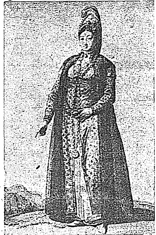
Bir saraylı kadının yazlık kıyafeti

Bu nasıl av merakıydı?.. Adeta cedlerinin büyük seferlerde katlandıkları bütün