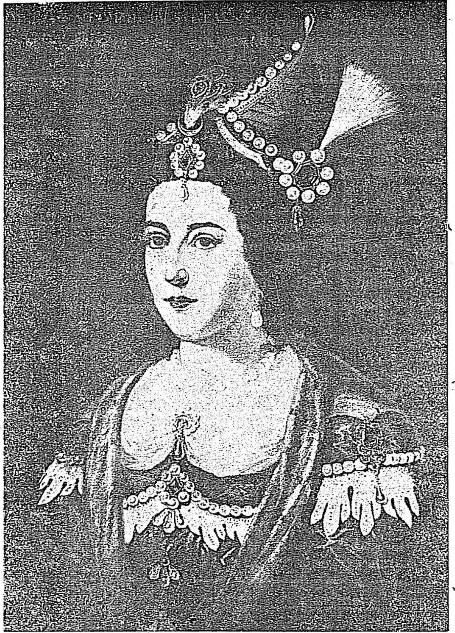
Osmanlı Sarayının en bahtiyar Sultanı olan Gülnûş'e atfedilen bir resim —Topkapı Sarayı Müzesinde—

Kıymetli tarihçi Adnan Giz'in bu yazısı, size yüzlerce sahifelik bir roman okumuş kadar zevk, heyecan ve merak verecektir. Osmanlı Sarayının hakikaten en mes'ud kadını olan Gülnûş, ızdırabın da en acısını çekmiş, fakat iki defa Valde Sultan olmak saadetine ermiştir. Hayatı korkunç av iptilâsile geçen dördüncü Mehmedin karısı olan Gülnûş, hiç bir Sultanın mazhar olmadığı imtiyazla zaman zaman kocasile korkunç dağları tırmanmıştır.