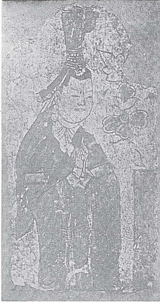
Uyghur Budizm devri duvar resimlerinden. ( Von le Coq, Uigurica'dan )