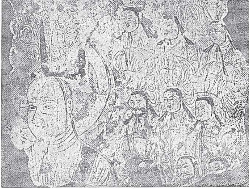
Mâni'nin ve din cemaatinin resmi. ( Von le Coq'un Karahoçu duvar resimlerinden )

Grünwedel, A. von le Coq ve Aurel Stein'in Orta Asya'da yaptıkları araştırmalar ve bunlardan von le Coq'un Uigurica adıyla üç büyük cilt halinde yayınladığı Turfan, Karahoçu, Biş Balık gibi Uygur - Türk şehirlerinde bulunmuş fresk (duvar resmi), resimli ve minyatürlü kitaplar milâttan sonra VII. ve IX. asırlarda bu sanatların Uygur Türklerinde ne derece ilerlemiş olduğunu açıkça gösterir 1 .