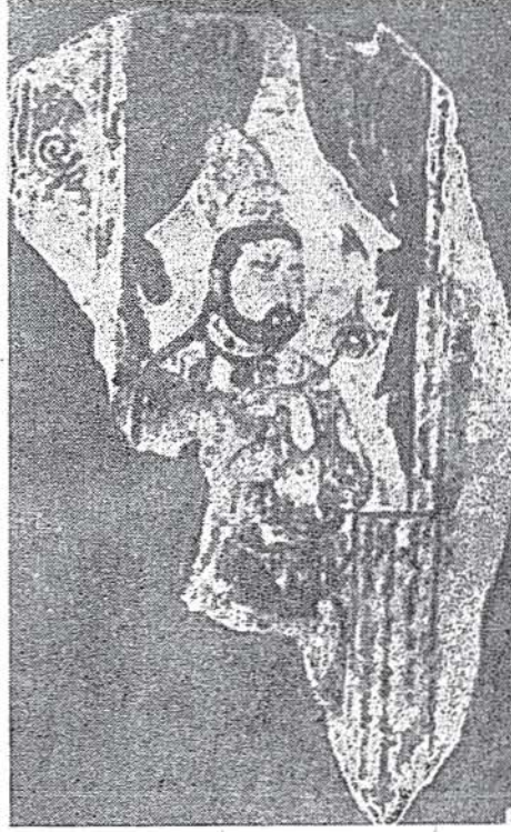
Bir Uygur prensine ait duvar resmi. ( Von le Coq, Uigurica'dan )

rolü olup, biri Selçuklularla, diğeri de Moğol istilâsı ile gelen Uygurlarla olmak üzere bu tesirler iki devirde kendini gösterir» 4 . «Moğol devrinde pek çok Uygur kâtip (bitikçi, bahşı) ve sanatkâr İslâm dünyasına gelmiş ve resmin canlanmasına tesir etmişti» 5 .