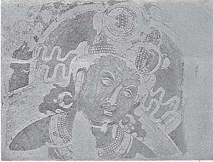
Uygur Budizm devri duvar resimlerinden.

temas etmektedir. «Put-perest Uygurların tapınakları (burkan-evi) putlarla (burhan-sanem) dolu idi. Ecdâdı tâzim ölülerin heykel ve resimlerine de tâzimi gerektirmiş ve bu suretle de heykel ve resim tapınaklara girerek bir nevi dinî mahiyet almıştı» 3 .