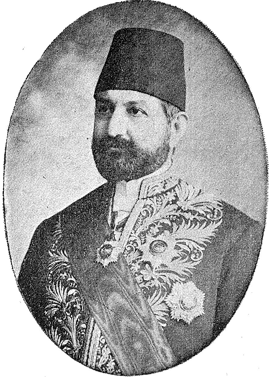
جمعیت تدریسیہ اسلامیہ رئیس وکیل محترمی اوقاف ہایون ناظری بخیری بک افندی حضرتلری