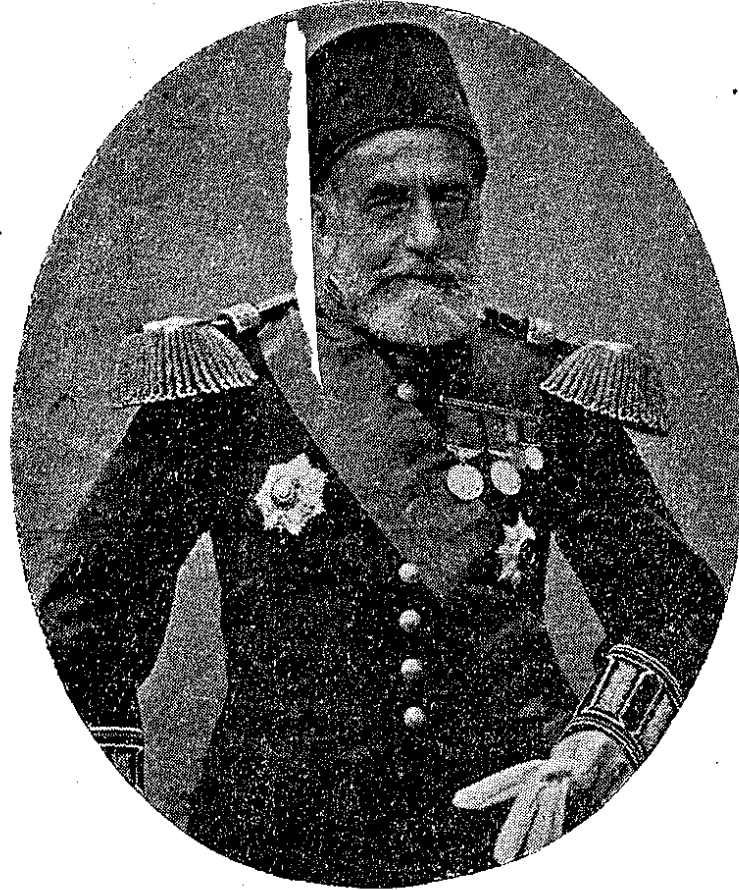
مؤسسیندن غربا خسته خانہ سی سرطابا بندن متقاعد احمد باشا

یختلہ و ہیئت عمومیہ قراریلہ رئیس اول صدراعظم پاشا حضرت تدرینہ یرتذکرہ تقدیمی خصوصہ قرار و اجتماعہ ختام ویرلمشدر . صدراعظم پاشا حضرت تدرینہ وکالہ معارف عمومیہ ناظری