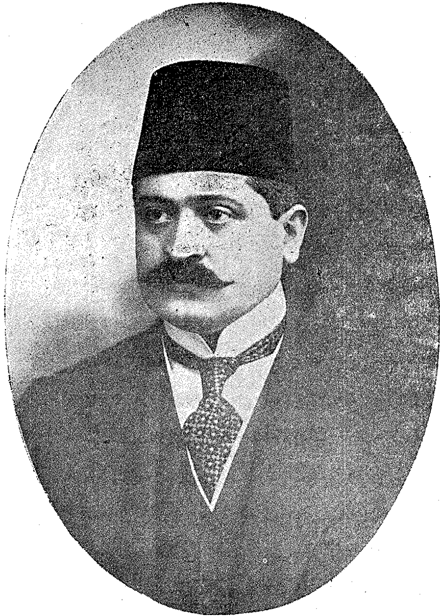
جمعیت تدریسیہ اسلامیہ ہیئت متشبتہ رئیس داخلیہ ناظری طلعت بك افندی حضرتاری

۲۱۶ ۰۰۰ قصبہ تیموریولی صاحب امتیازی موسیو نا کلا کرس طرفدن دارالشفقہ یه ۱۸ تموز سنه ۳۱۰ تاریخنده اعانہ اعطا اولمشدر .