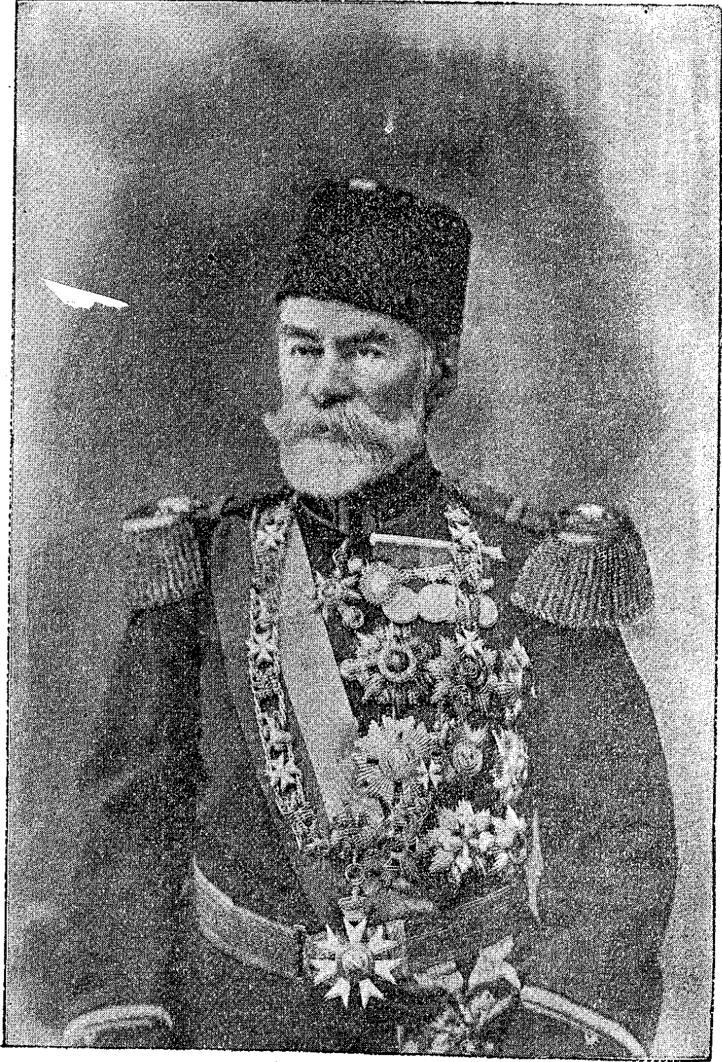
جمعیت تدریسیہ اسلامیہ مؤسسے صدر اسبق غازی احمد مختار پاشا حضرتلری