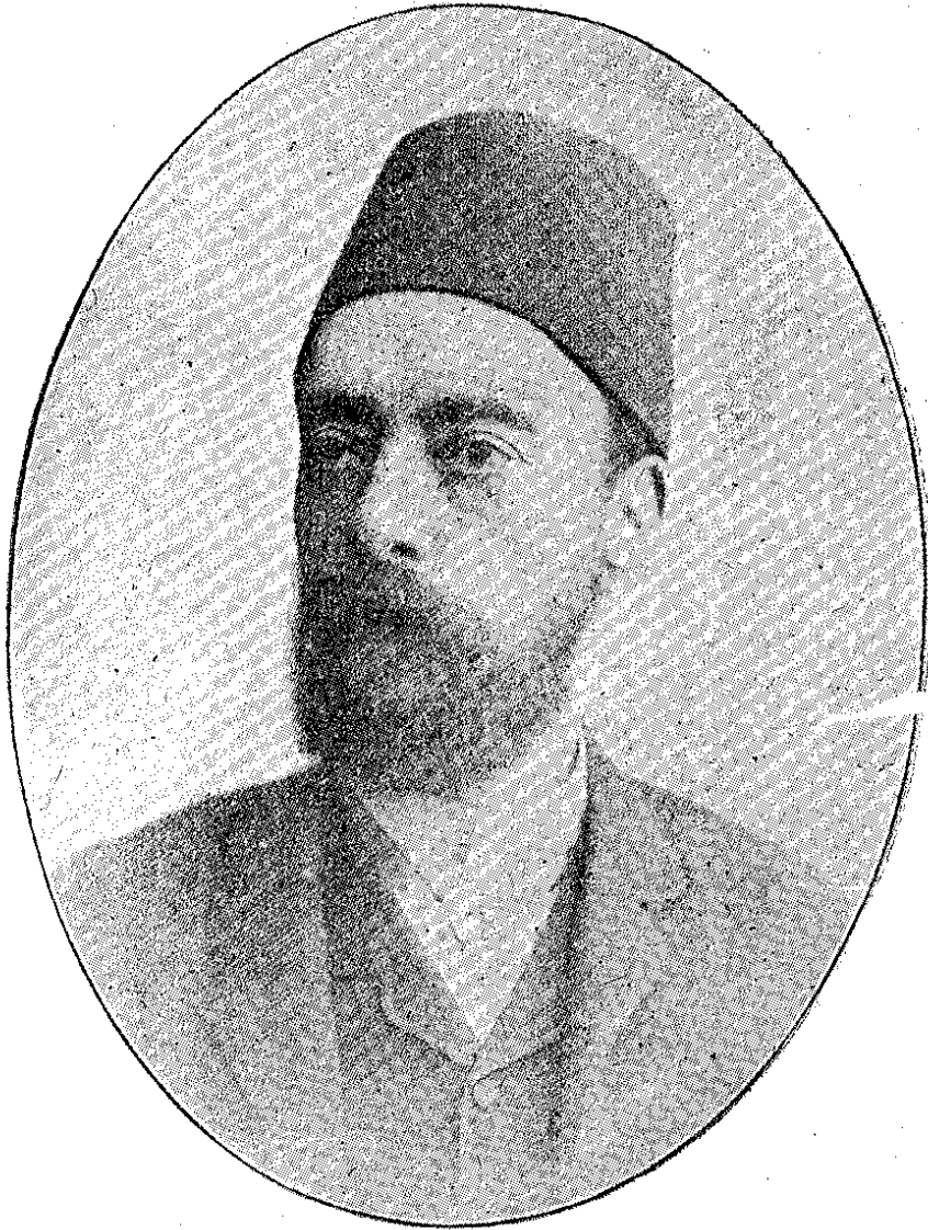
مؤسسین جمعیتدن ویانه سفیری سعده پاشا

مذکور بش ذاتک یرینه اتخابی لازمکلان دیگر بش اعضا ایچون دخی کذک رأی خفی اصولیه طویلانیلان آراده شورای دولت یدایت محکمه سی رئیس اسماعیل حقی بک، مالیه نظارتی املاک مدیری هاشم بک، اوقف نظارتی سرمهندسی قدری بک، معلمیندن بیکباشی نوری بک، خزینه خاصه شاهانه محاسبه مدیری اسماعیل بک اکثریت قزاندقلری اکلایشیله رق مجلس اداره اعضالغنه تعیین ایدلمشرو مجلس اداره اعضاسی ذوات آتیه دن تشکل ایتشددر : پوسته مدیر عمومی