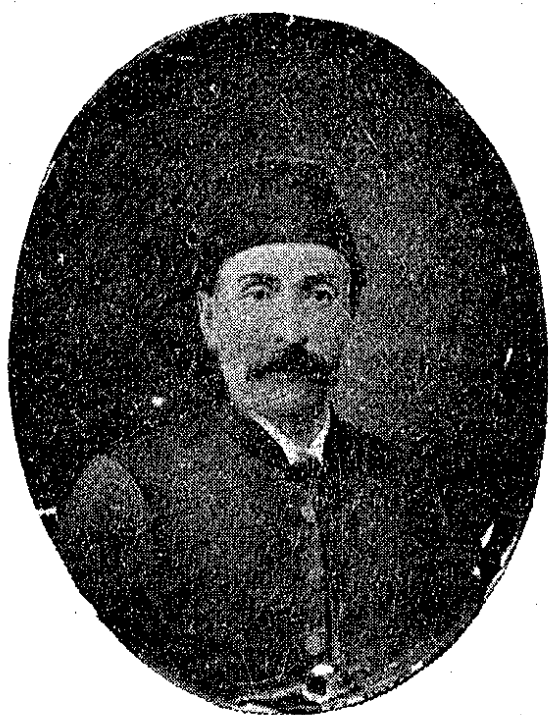
جمعيت تدريسيه اسلاميه مؤسسلرندن باب سر عسكري مبايعات روزنامه جي قلمي خلفاسندن محمد جمال بك

منسوب اولديني شاه خوبان خاتون وقفه اعطاسي لازم كه جكنه دائر اوقاف هايون نظارت جليله سنك تذكرة سي ملفوفيله برابر عرض و تقديم قلمش اولغله اولبابده امرنه وجهله اراده سنیه حضرت خلافتناهي شرفستوح و صدور بيوريلور ايسه منطوق منيفي انفاذ ايديله جيكي بيانيله تذكرة ثناوري ترقيم قلندي اقدم.