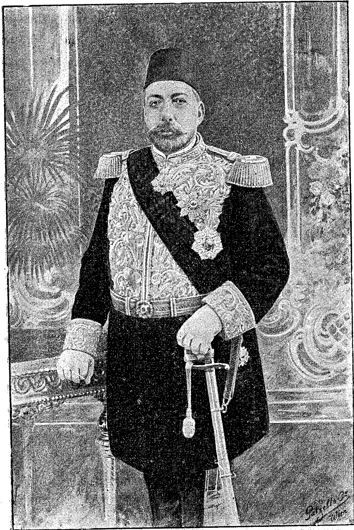
پادشاه مشروطیت پرور اعظم ، خلاقیناہ مفخم شوکتلو سلطان محمد رشاد خان خامس حضرتلری