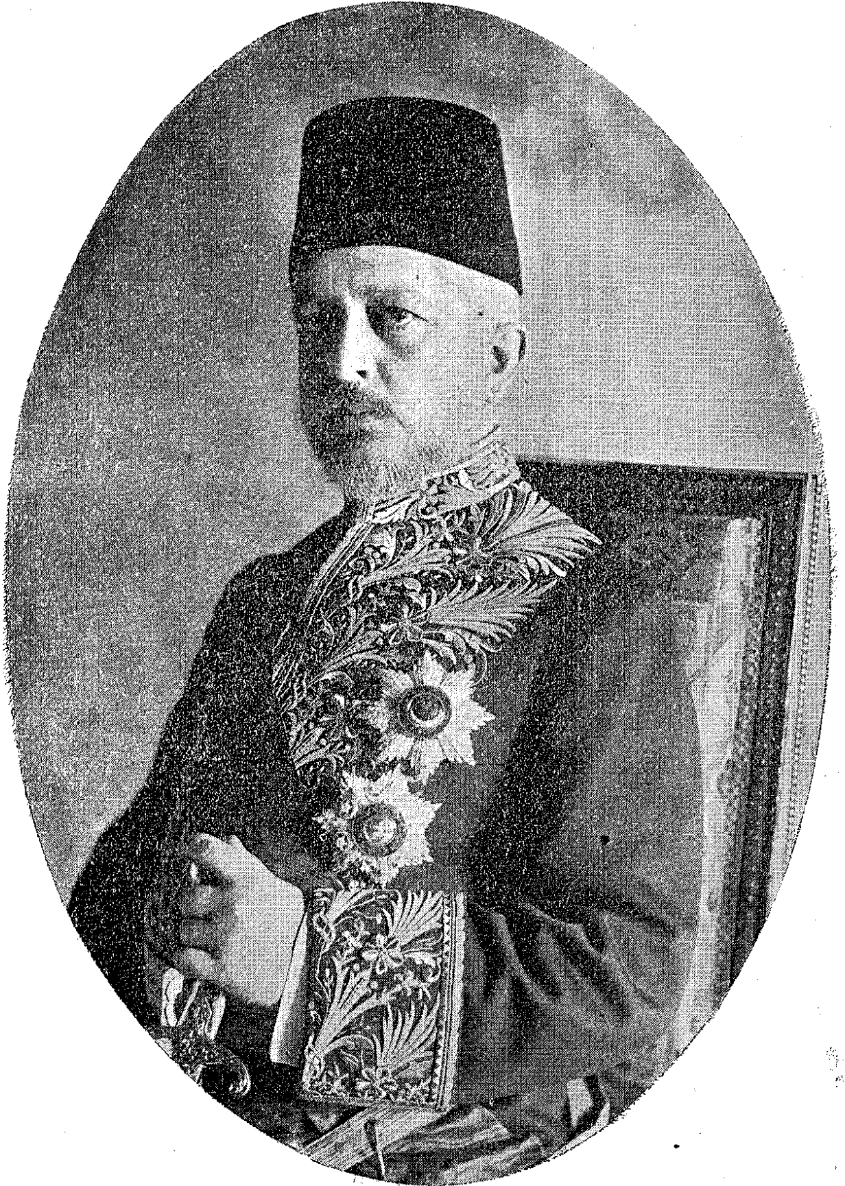
جمعیت تدریسیہ اسلامیہ رئیس محترمی فیخامتلو دولتو سعید حلیم پاشا حضرتلری