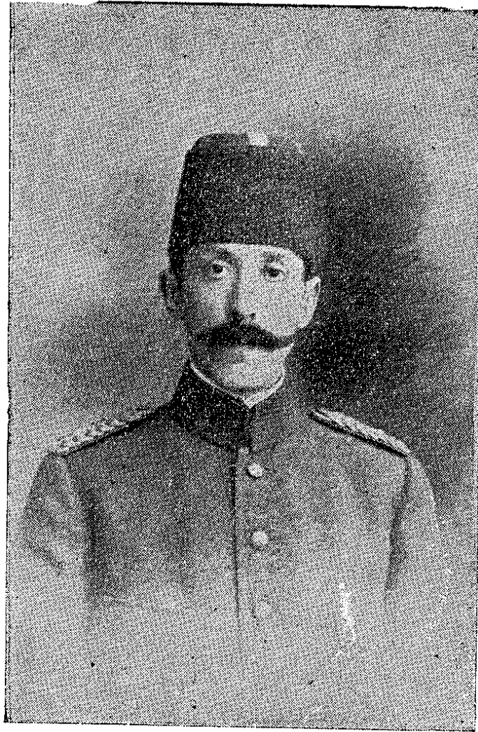
هیئت اداره اعضای سابقه سندن نوری بک

پوسته و تلغراف نظارتی اقلامنه مأمور ایدیلوب ایلاک سنه اوچ ایرتسی سنه ایکی مستعد افندی ۱۲۹۹ سنه سی ایلولنده اکیال تحصیل ضمنده پارس شهرنده کی تلغراف مکتبینه اعزام قلمشیر ایدی. بو افندیلر عودت لرنده خدمت لرندن حکومتجه استفاده اولنمظه پارسه طلبه اعزامی رسماً منع ایدلیکی تاریخه قدر هر ایکی سنه ده ایکی افندینک پارسه اعزامیه اکیال