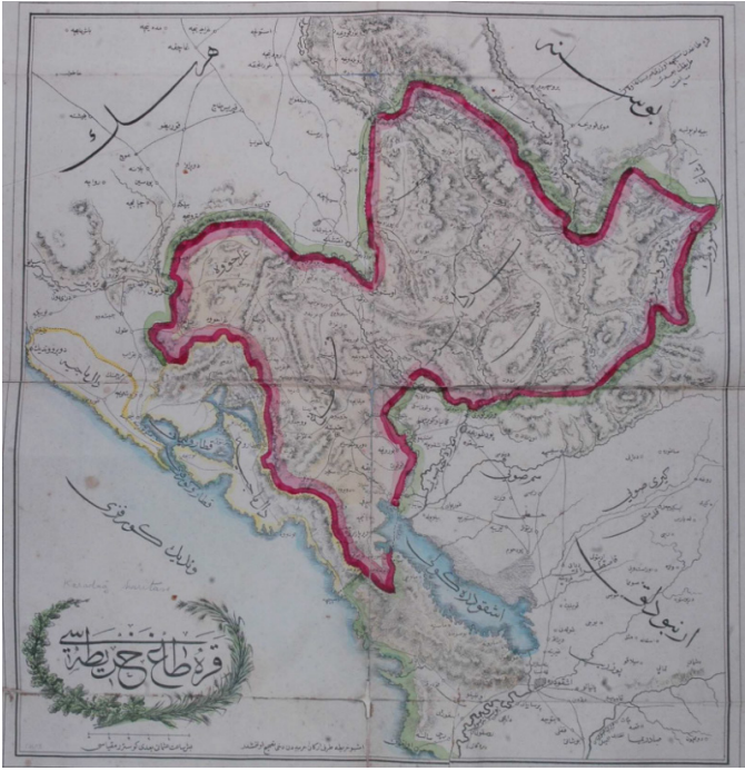
Harita 2: 1859 Sınır Değişimi Sonrası Karadağ Sınırları