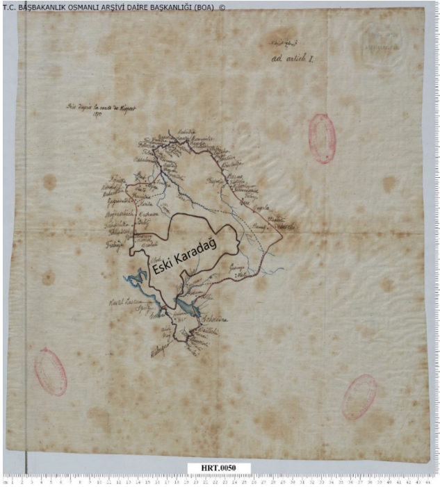
Harita 1: Eski Karadağ sınırları

Karadağ Osmanlı hakimiyetine girdikten sonra ilk sınır değişimini 1858 yılında Osmanlı Devleti ile yaptığı Grahova Savaşı neticesinde yapmıştır. 1858 Grahova Savaşı sonrasında toplanan İstanbul Konferansı ile Grahova ve çevresinin Karadağ sınırlarına dahil edilmesi kararlaştırılmıştır. Sınır değişimi 1859 yılında tamamlanmıştır. Bu değişimle Karadağ'ın sınırlarına 1.500 km 2 eklenerek sınırları 4.400 km 2 'ye çıkarılmıştır. 4 Ancak hem 1859 yılında oluşan sınırların da hem de daha önceki sınırlarında Müslüman nüfus yok denecek kadar az olduğundan buralarda cami veya mescit az sayıda yapılabilmektedir.