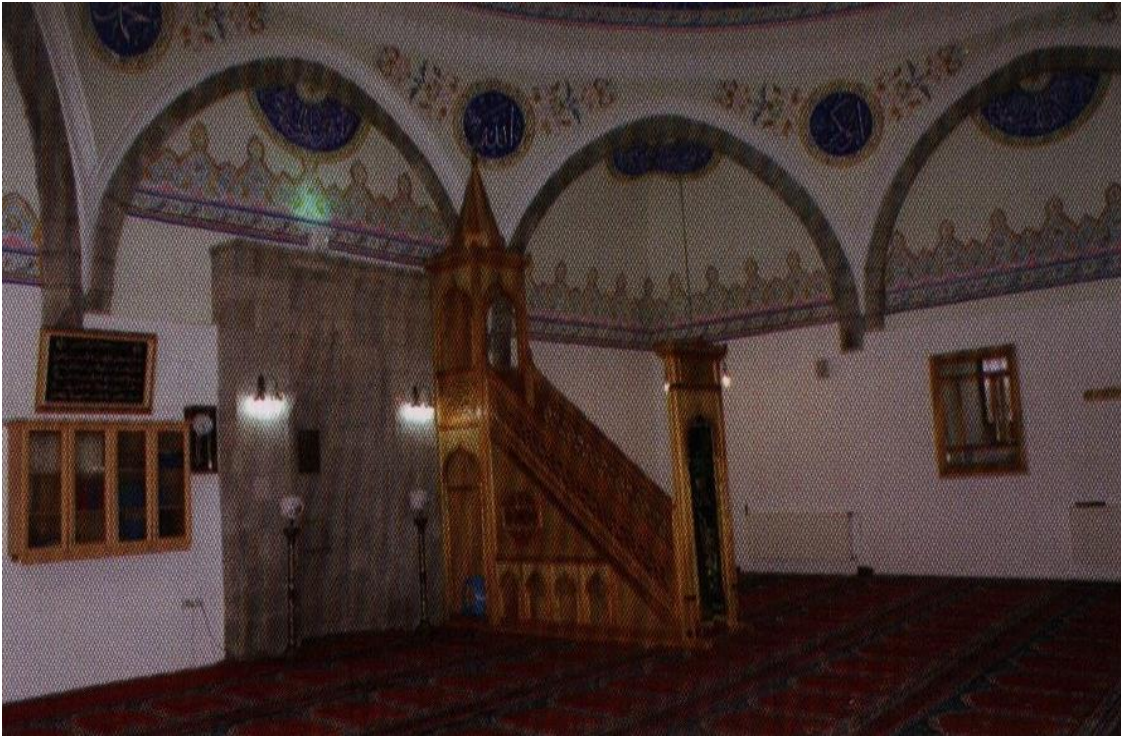
Resim 3. Erzurum Boyahane İç mekan Minber Bölümü.

Geçit bölümü, Bursa kemerli ve köşk dört yönde açık tutulmuştur. Külâh bölümü çokgen bir kasnağa oturtulmuş ve külâh da çokgen olarak düzenlenmiştir (Resim 3).