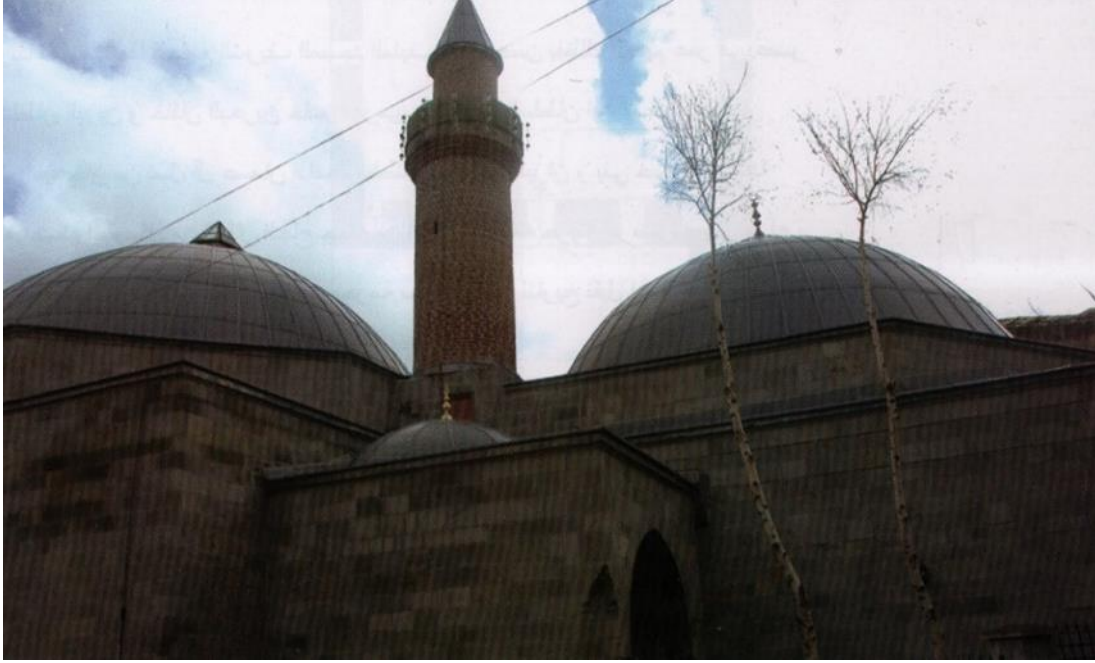
Resim 1. Erzurum Boyahane Cami ve Minaresi.

Caminin içerisinde bulunan kalem işi süslemeler, orijinal değil, sonradan ortaya konulmuştur. Hamamın soyunmalık bölümüyle birleşen minare silindirik gövdeli olarak tasarlanmış, tuğlaların farklı biçimlerde örülmesiyle oluşturulan harmoni, minareyi etkili bir biçimde ortaya çıkarmaktadır.