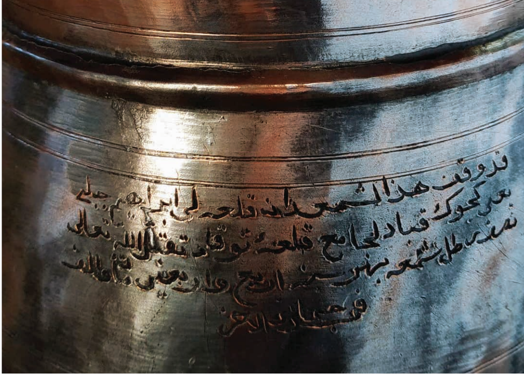
Görsel 2: 60.00543 Envanter Numaralı Şamdan'ın Vakfiye Kaydı