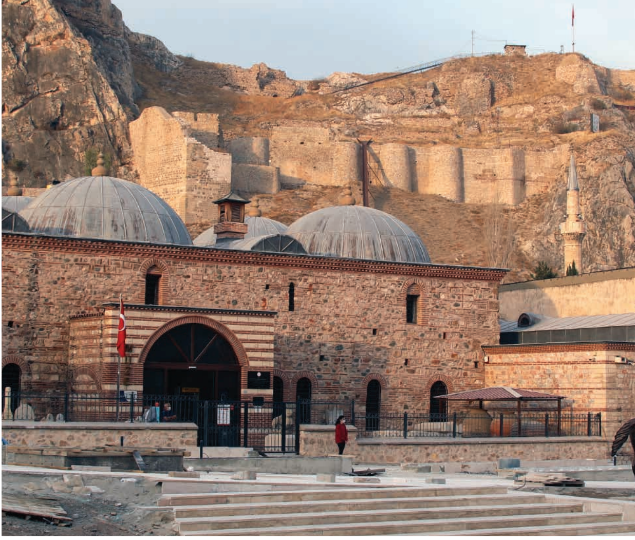
Tokat Kalesi

yer almaktadır. Bu bilgidan para vakıflarında kredi olarak alınan paralara %20 riba (yasal faiz) uygulandıđı anlaşılmaktadır.