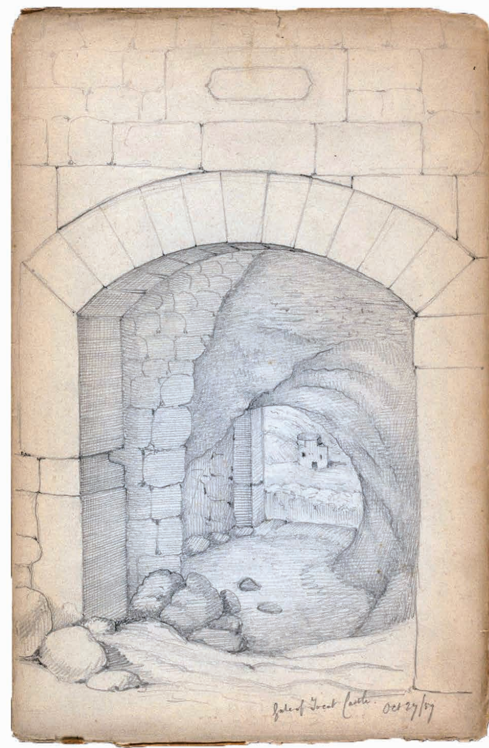
Çizim 1: Henry John Van Lennep'in Tokat Kale Kapısı ve Kale Camii çizimi 1