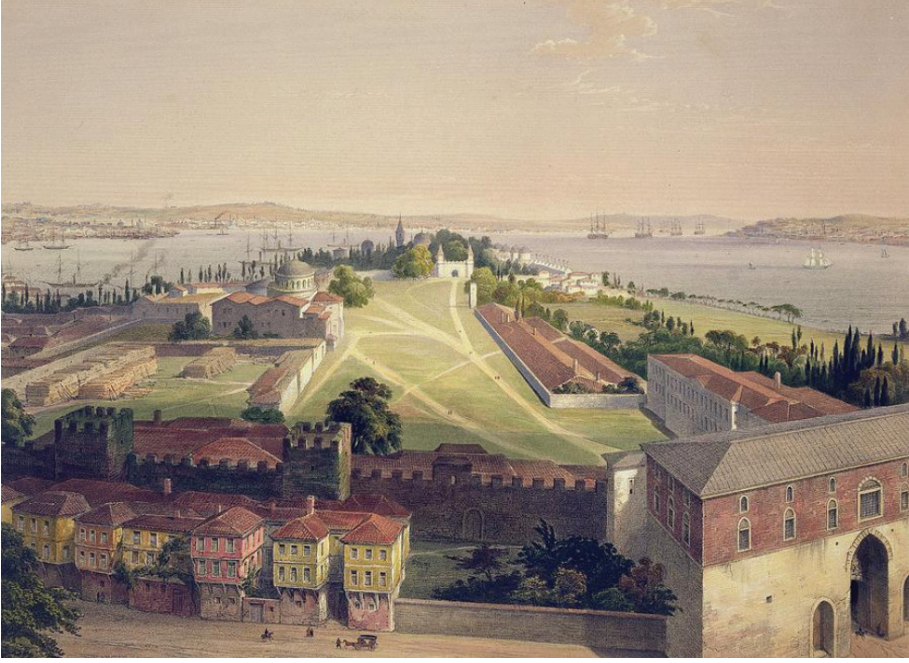
Görsel 4: Soğukçeşme Sokağı'nda Sur-i Sultani önünde yer alan haneler, Bab-ı Hümayun'un kuzeybatısında kalan ilk yapı Nazikî Tekkesi, Fossati, 1852. 8

Tekke, ilk kullanımında birbirine benzeyen üç yapı biriminden olan tevhidhane, harem ve selamlık dairesinden oluşmaktadır. 9 Eski fotoğraflara göre yapı, üç katlı, kırma çatılı ve ahşaptır. 19. yüzyılda cephe üzerinde kullanılan ahşap payandalar düz formlarda kullanılırken 20. yüzyılda, onarım ya da yeniden yapım sonrasında furuşlar eklenerek kullanılmıştır. Nazikî Tekkesi, geleneksel Türk Mimarisi üslubunu bütünlük ve tutarlılık içinde 1940'lı yıllara kadar korumuştur. 1980'li yıllara gelindiğinde ise sokaktaki diğer evlerle birlikte Nazikî Tekkesi harap duruma gelmiştir.