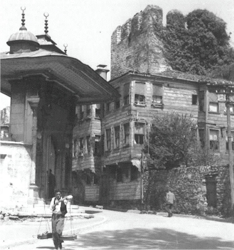
Görsel 6: Ayasofya İmaret Kapısı ve Naziki Tekkesi, 1954 15