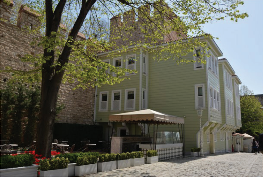
Görsel 7: Naziki Tekkesi (Yasemin Pansiyon), 2021 16