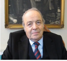
Eski Türk Basın Birliği Başkanı Engin Baydar