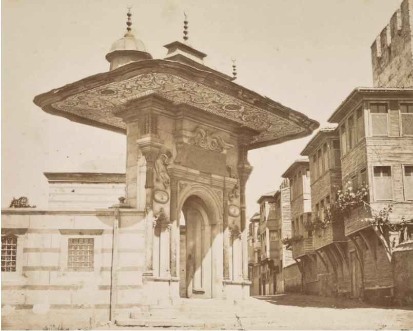
Görsel 5: Ayasofya İmaret Kapısı ve Nazîki Tekkesi, 1875-80 14

Sonuç olarak, Nazîki Tekkesi, konumu ve tarihsel süreç içerisindeki var oluşu ile korunmaya değer yapılarımız arasında önemli bir örnektir. Ancak, gerek vakfiyesinden bağımsız özgün kimliğinden koparılmış, gerekse ticari faaliyetlere fayda için özgün mimari dokusundan koparılmış görsel bir dekor haline getirilmiştir. Bu çalışma ile, mevcut bir tarihi yapıda yaşanan yapısal dönüşümler incelenerek koruma sorunları üzerinden eleştiriler getirmek ve koruma çalışmalarına katkı sunmak amaçlanmıştır.