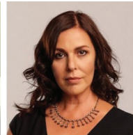
Sanatçı Lale Mansur