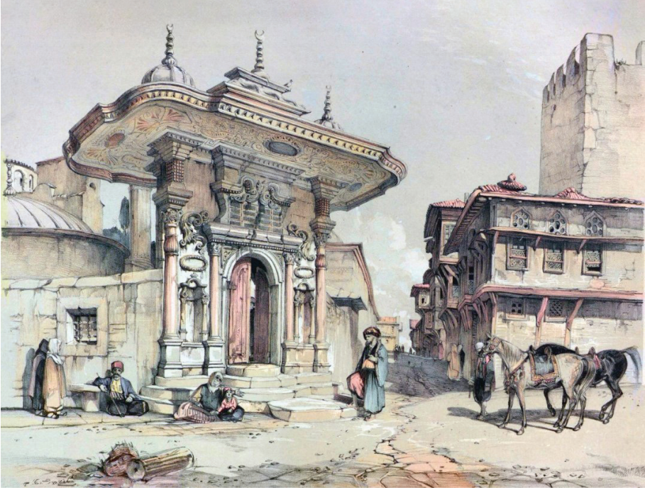
Görsel 3: Ayasofya İmaret Kapısı ve Nazikî Tekkesi, Lewis, 1830 görünümü. 6

Tekke ile ilgili bilinen en eski gravür, 1830'ların başında İngiliz asıllı John Frederick Lewis tarafından çizilmiştir. Bu gravüre göre, tekke yapısı diğer yapılardan farklı olarak daha çok Anadolu konutu karakterine sahiptir. Kâgir olarak inşa edilen yapı zemin ve normal kat olmak üzere toplam 2 katlı, tepelik pencerelere sahip ve üzeri sıvalıdır.