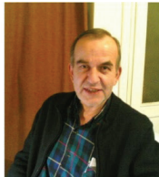
Söz yazarı, besteci ve müzik yapımcısı Onur Yurdatapan