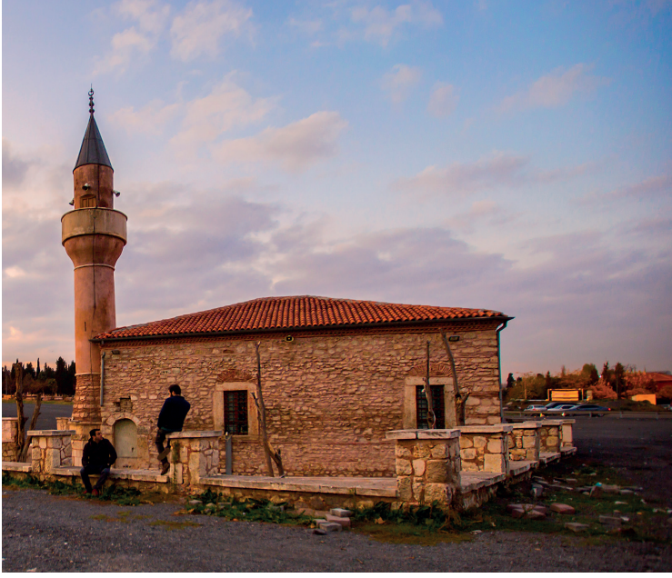
Merzifonlu Kara Mustafa Paşa Mescidi

Kazlıçeşme'de, aynı adı taşıyan çeşmenin biraz güneyinde yer alan Merzifonlu Kara Mustafa Paşa Mescidi, Kasaplar ve İskele Mescidi isimleriyle de anılmaktadır. 17. yüzyılın sonlarında Merzifonlu Kara Mustafa Paşa tarafından yaptırılmıştır. 1780 yılında geniş çaplı bir onarım görmüş, zaman içinde harap olunca, son yıllarda tekrar onarılmıştır.