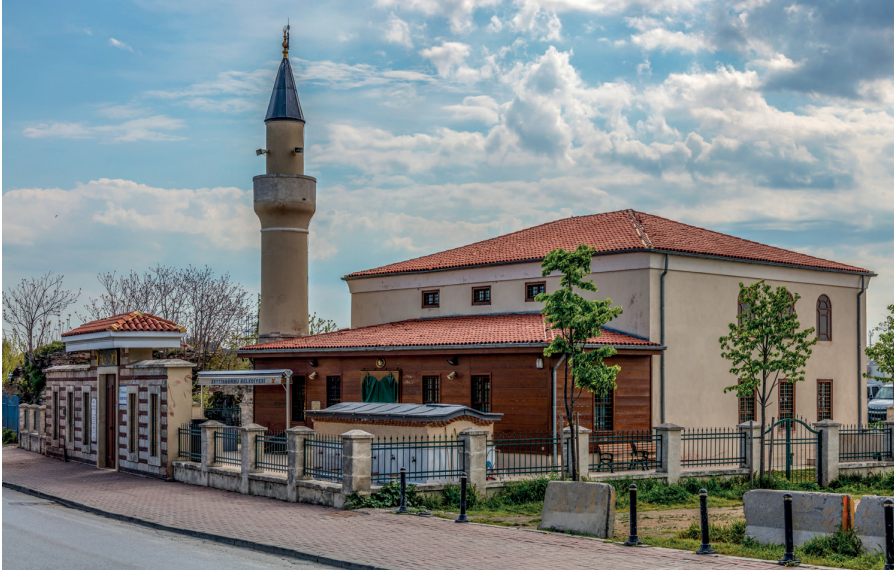
Kazlıçeşme Fatih Camii

Kazlıçeşme Mezarlığı'nın karşısında Zakirbaşı sokağında bulunan Fatih Camii'nin inşa tarihi kesin olarak bilinmemektedir; ancak bazı taşlarının 1450'li yıllara ait olduğu saptanmıştır. İstanbul'un fethi öncesinde Yedikule surlarının arkasında ordusuyla konaklayan Sultan II. Mehmed'in bu camiyi askerlerinin ibadetlerini yapmaları için inşa ettirdiği de rivayet edilir.