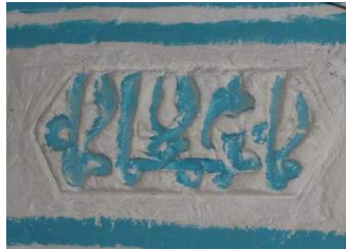
F: 4 II. Bordür çini süsleme- Kûfi yazılı kartuşlar