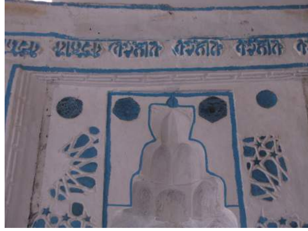
F: 5 Mihrap detay