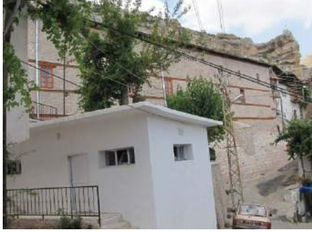
F: 1 Ermenek Ulu Camii