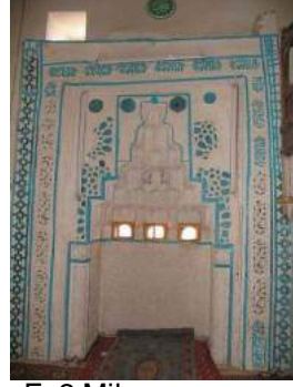
F: 2 Mihrap