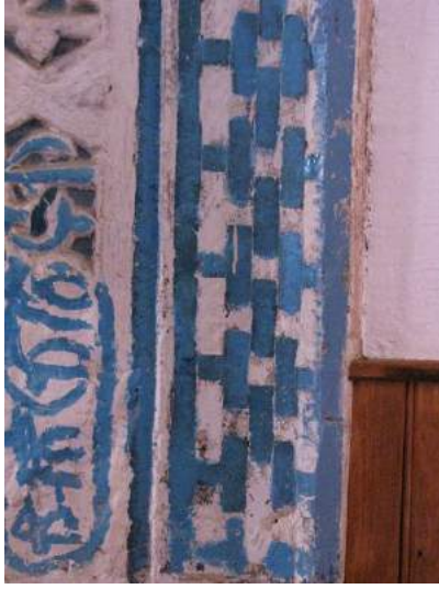
F: 3 I. Bordür çini süsleme