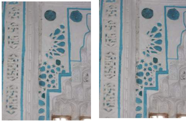
F: 6 Mihrap köşelikleri