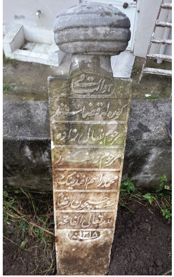
Mehmed Abdurrauf Efendi'nin Mezar Kitabesi 35

Hüve'l-Bâkî Görelle kazâsında Merhûm Bakkalzâde Merhûm ve mağfûr Mehmed Râsim Efendi'nin Rûhıçün rızâen L'illâhi Te'ale'l-Fâtîha Sene 1318