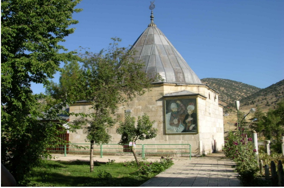
Resim 1: Elmalı Tekkeköy'deki Abdâl Musa Tekkesi