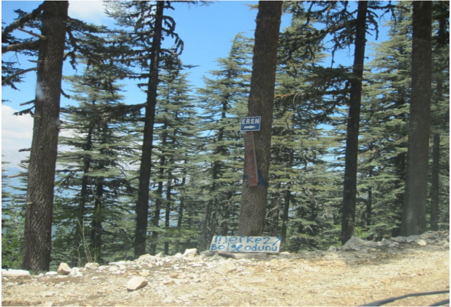
Resim 4: Eren'e giden yoldan bir görüntü