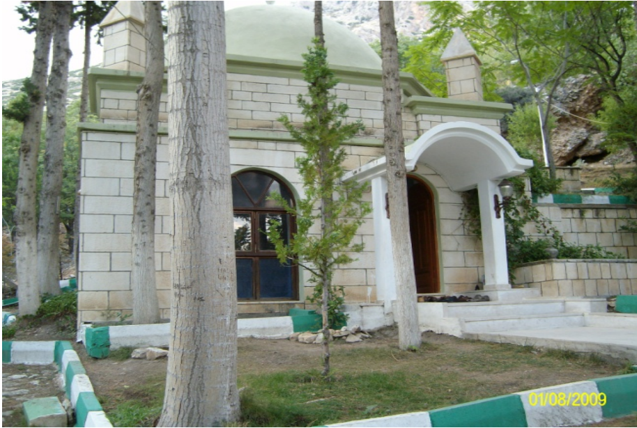
Resim 2: Elmalı'daki Abdülvehhâb Ümmî Türbesi