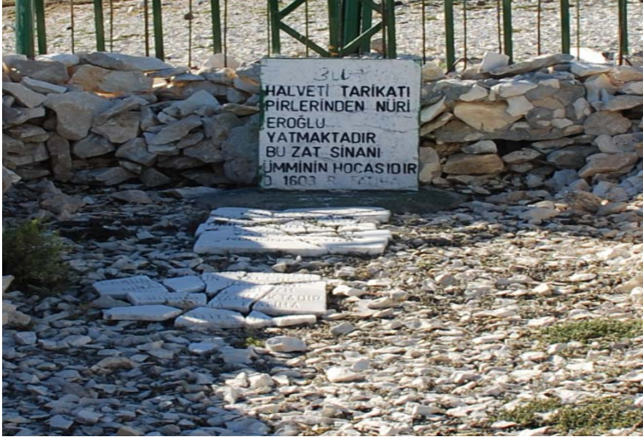
Resim 7: Eroğlu'nun mezar taşının görünümü