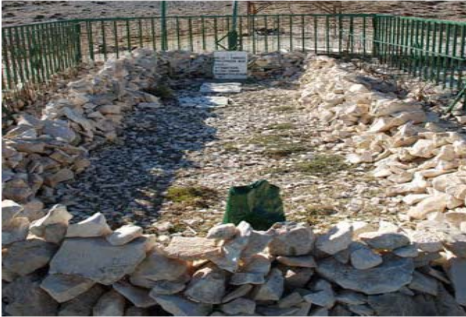
Resim 6: Erođlu Nûri'nin mezarı