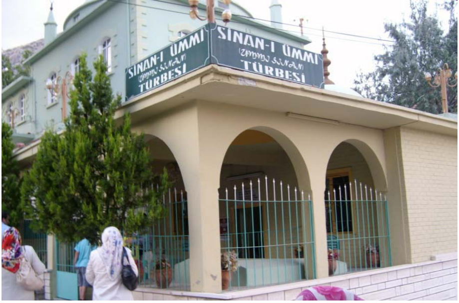
Resim 3: Elmalı Ümmî Sinan Türbesi