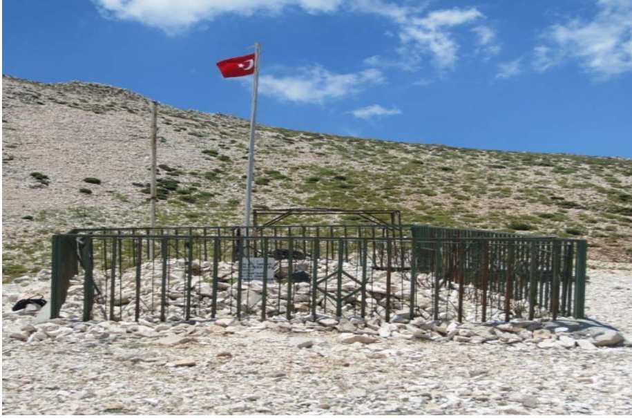
Resim 5: Erođlu Nûri'nin mezarı