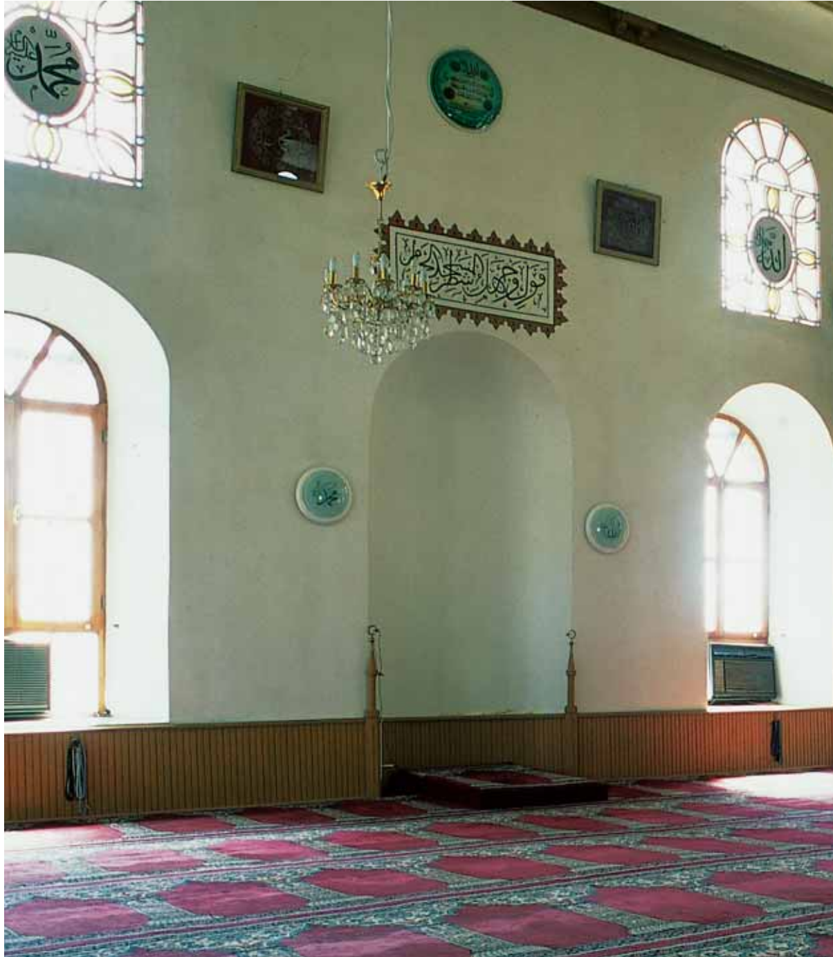
Fatih Cami'nin içi ve dış görünümü.

baskı tekniği ile yapılmış yenileri konulmuştur. Bunlardan bazılarının Gülbenkyan tarafından Lizbon'daki Salazar Müzesine hediye edildiği bilinmektedir. Cami, mermer minberi, şebekeli korkuluğu, kafesli yanlıkları ve sade silmeleri ile devrinin güzel ve nispetli bir eseridir. Ahşap kubbe yıldızlı çıta ile dilimlenmiş, eteklerindeki mukarnasları altın yıldızlı