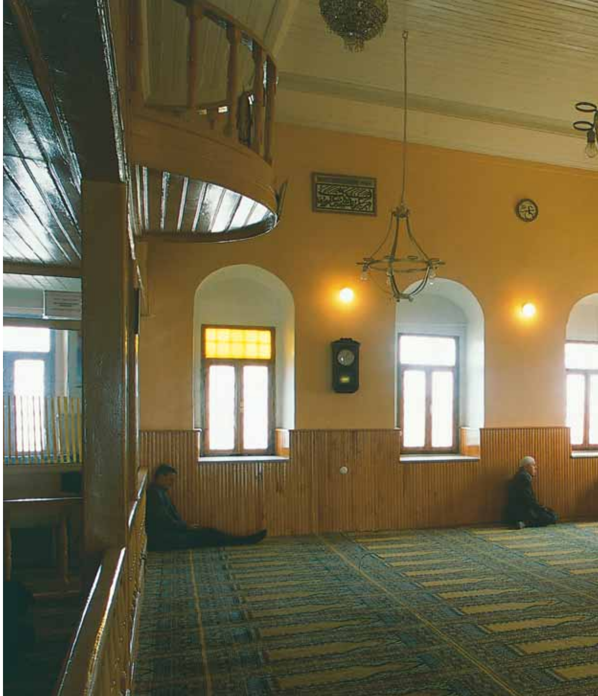
Kazlıçeşme'nin bugün boş olan alanın ortasındaki Merzifonlu Kara Mustafa Paşa Mescidi'nin iç görünümü.

Takkeci İbrahim Ağa defalarca düşünde “Bağdat’a git, köprüünün başındaki hurma ağacının altında bulunan asmada senin üç üzüm tanesi kısmetin vardır. Onu al, ye!” sözlerini işitir. Bu düşü birçok kez tekrarlanınca Bağdat’ın yolunu tutar ve düşünde gördüğünün aynısını yaparak üzümleri yer. Sonra da düşünmeye başlar. Yanına yaklaşan bir ihtiyar niye düşündüğü-