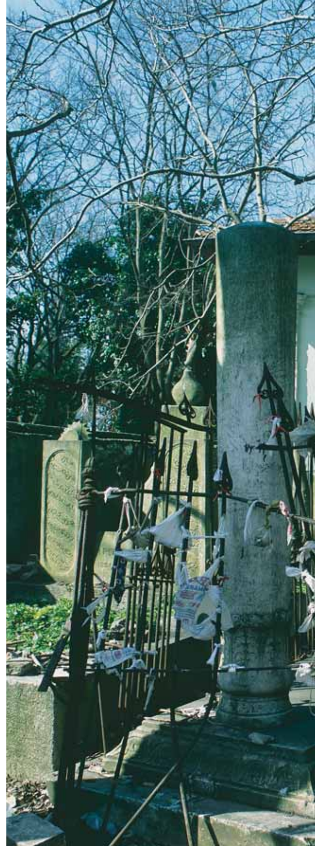
Merkez Efendi Cami-tevhidhânesi'nin arka kısmı.

Cami-tevhidhânenin batı duvarında , son cemaat yeri ile harimin sınırında yer alan minarenin, dışa taşkın, kare tabanlı kaidesi bir sıra kesme küfeki taşı ve iki sıra tuğla ile almaşık düzende örülmüştür. Yapının ilk inşa döneminden günümüze intikal eden yegane ögesinin bu kaide olduğu, minarenin geriye kalan kısmının II. Mahmud döneminde yenilediği bilinmektedir. Nitekim birçok geç dönem minaresinde olduğu gibi , burada da pabuç kısmı olmaksızın, silindirik biçimindeki gövde doğrudan kaideye oturur. Tuğladan örülen gövde altta kesme küfekiden bir bilezikle kavranmış, altı silmelerle dolgularan şerefe kesme taştan bezemesiz korkuluklarla kuşatılmış, minare, koni biçiminde kurşun kaplı bir ahşap külahla taçlandırılmıştır. Basık kemerli minare kapısı müezzin mahfiline açılmaktadır. Cami- tevhidhânedede, hünkar mahfili şebeke-