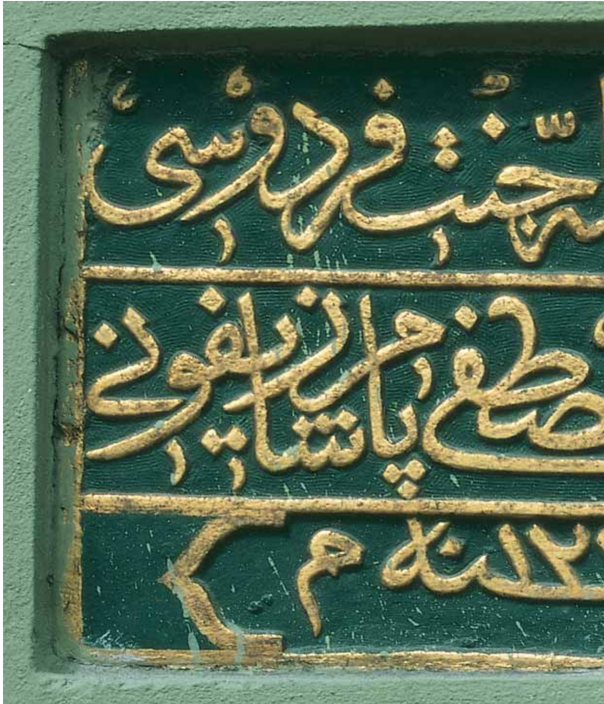
Camide yer alan kitabelerden biri.

mimari unsuru günümüze kadar orijinal şekliyle gelebilmiştir. Camii iki kez esaslı bir onarım görmüştür. Bunlardan ilki 1830 yılında , ikincisi ise 1985'de Vakıflar İdaresi tarafından yapılmıştır. Son onarımda mahvil tavan , dikme ve kemerlerinde orijinal altın yıldızlı nakışlar bulunmuştur. Giriş kapısının iç tarafındaki tavan üzerindeki nakışlı parça ise, tamir edilmek için