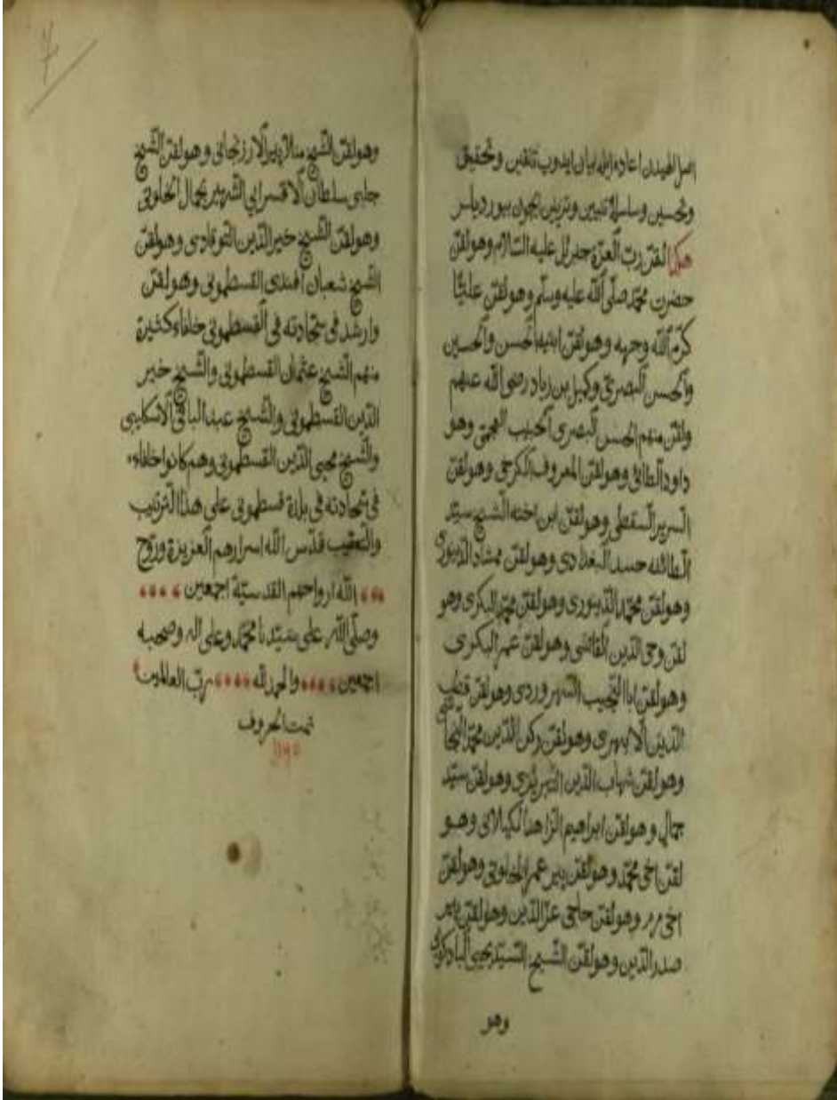
Resim 2. Silsilenâme'de Şeyh Şabân Veli'nin silsilesinin verildiği 6b-7a varakları