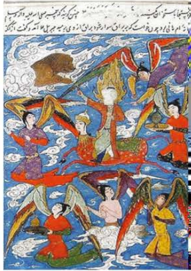
Mi'rac, Kısas-ı Enbiyâ, 1550-1600, olasılıkla Şiraz, Topkapı Sarayı Kütüphanesi H. 1228, fol. 152v.