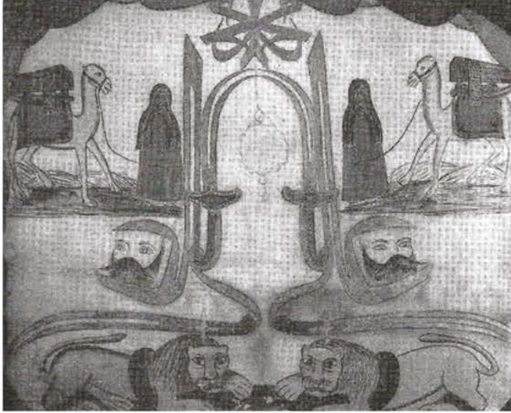
Yazı Resim, Durbalı Sultan Tekkesi-Yunanistan (Raya Shani)