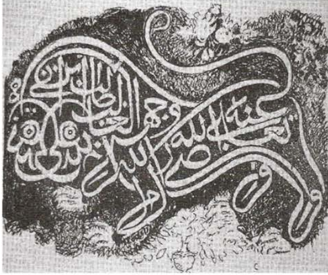
Aslan Yazı Resmi, Özel Koleksiyon, İstanbul (Thierry Zarccone)