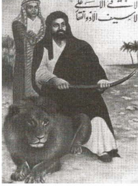
Hz. Ali, Aslan ve Kanber, 20. Yüzyıl, İran (Fahmida Suleman)