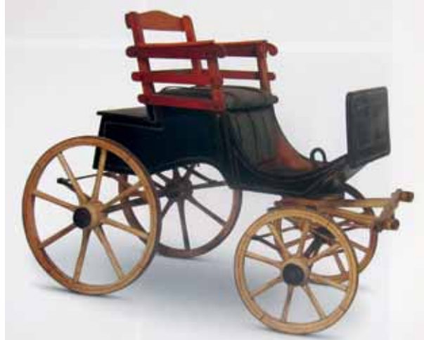
Fotoğraf 4. Şehzadelerin ve Hanım Sultanların çocukken gezdikleri araba.

Damatlar genellikle Enderun mektebinden yetişen devşirme devlet adamlarıydı. Padişahın kızıyla evlenerek hanedanın üyeleri arasına girer ve siyasi otoritelerini arttırmış olurlardı. Padişah kızını evlendirmek isteyince sadrazama bir hatt-ı humayun yazar ve damadın nişan takımlarını yollamasını emrederdi. Uygun görülen adayın, fermanı alır almaz eğer evli ise, sultanlara hürmeten hanımını boşaması