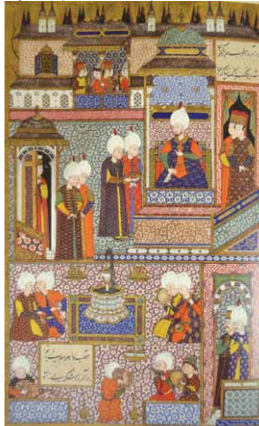
Fotoğraf 5. Mihrimah Sultan'ın düğününde Sultan Süleyman düğün hediyelerini kabul ediyor.

Mihrimah'a kadar, gelin olan sultanlar eşleriyle taşraya giderlerken, I. Süleyman ve Hürrem Sultan biricik kızlarının İstanbul'dan ayrılmasına izin vermediler. Bu durum yeni bir hanedan geleneğine yol açmış olup, sonraki sultanlar, eşleri taşraya görevine gitse de İstanbul'da kalmışlardır (Sakaoğlu 2008).