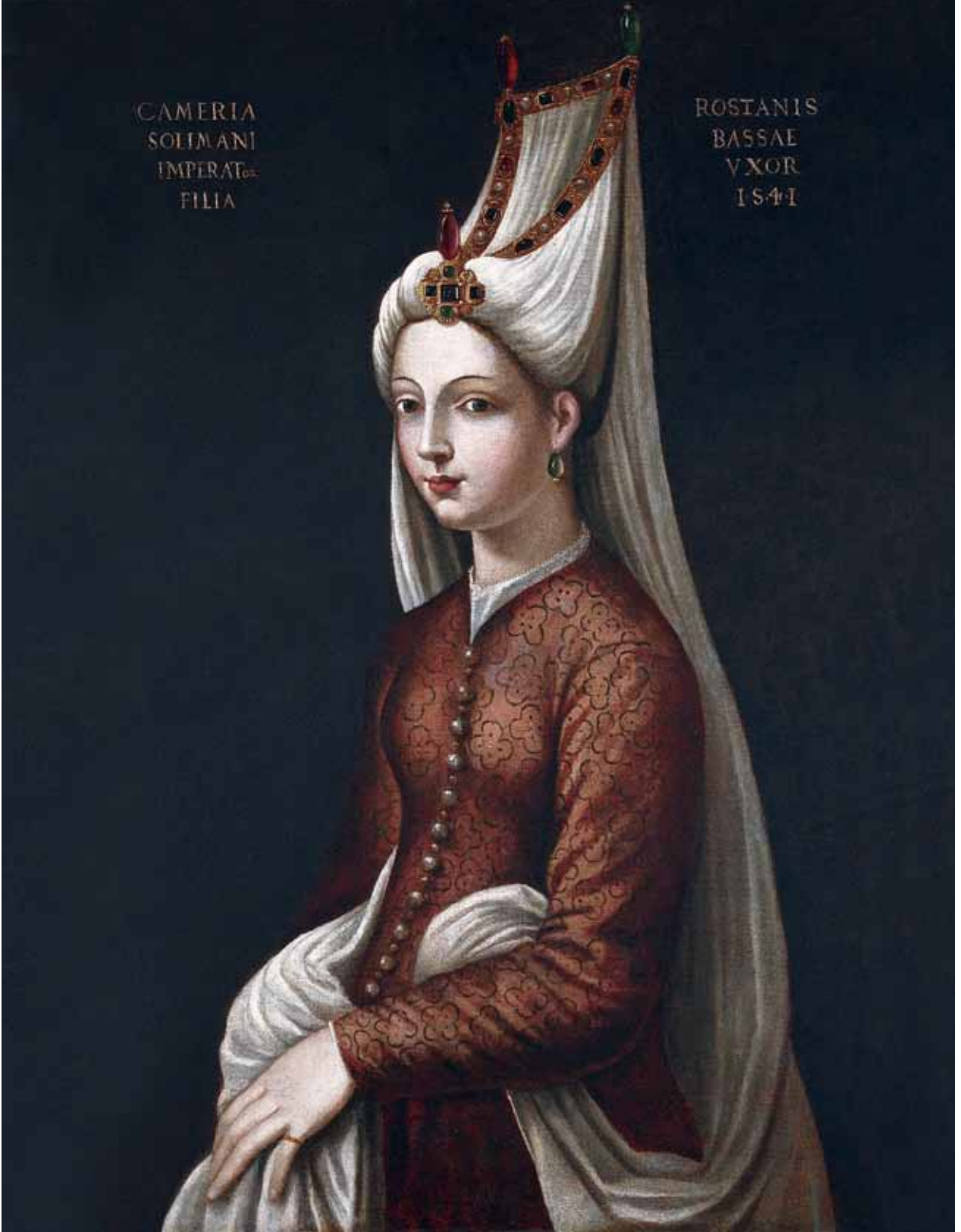
Fotoğraf 9. Mihrimah Sultan Portresi (Plock Şehri Müzesi-Polonya).

Imperator Filia (Sultan Süleyman'ın Kızı Camera), sağ üstte ise, Rostanis Bassae Vxor 1541 (Rüstem Paşa'nın Karısı, 1541) yazılıdır. Buradaki tarih, olasılıkla resmin yapıldığı tarihi belirtmez. Farklı sanatçılar tarafından yapılmış benzer portrelerin hemen hepsinde bulunan bu tarih ve yazılı ibarenin, olasılıkla orijinal ilk portreyi tekrarlayarak süregelen bir tanımlama olduğu düşünülebilir. Mihrimah Sultan Avrupalılarca Camaria adıyla anılmaktadır.