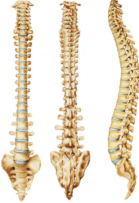
İnsan omurgası ve en uç kısmında bulunan acbü'z-zeneb kemiği

ledikleri ile insan, mükemmele ulaşma ve kemâl noktasına varma arayışı içerisinde. Su nasıl engelleri aşarak yatağını bulur ve hedefi olan ummana ulaşırsa, insan da bir şekilde çekilen setleri devirir, örülen duvarları yıkar ve kendi ummanına yani öte dünyada hazırlanmış olan ebedî hayata ulaşır. Bunun için belki en kestirme yol insanın bizzat kendisini bilmesidir. "Kendini bil" diyen Sokrat belki de buna işaret ediyordu. İslâm ümmeti içerisinde yerleşen ve peygamber sözü muamelesi gören "kendini bilen Rabbini bilir" deyişi, Kur'an'da geçen insanın âfâk ve enfüsü (bk. Fussilet 41/53) yani çevresini ve kendisini bilmesi ile örtüştüğünden bu kadar kıymetli bulunmuş ve bir yol gösterici deyiş olmuştur. İnsanın bilinmesi, ilk insan ve ilk peygamber Hz. Âdem'in bilinmesidir. Çünkü her insan bir Âdem ve Âdem her insan tekinin bir örneğidir. "Hz. Âdem nasıl yaratılmıştır?"; "Bütün insan zürriyeti ondan nasıl meydana gelmiştir?"; "İlk yaratılıştta bütün zürriye-