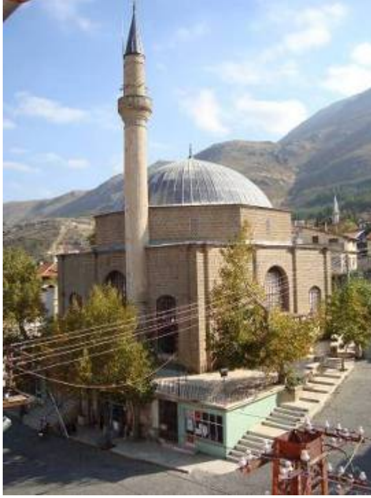
Res.1: Hıdır Çelebi Camii, Genel Görünüm, Kuzeybatı Cephe