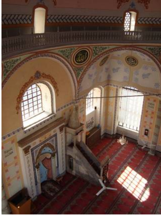
Res.4: İç Mekân-Harim