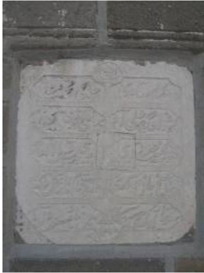
Res.2: Minare, Kitabe