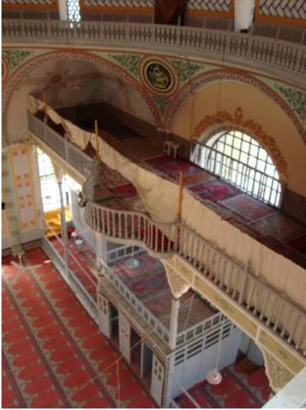
Res.5: İç Mekân, Kadınlar Mahfili