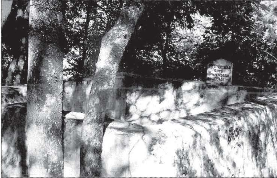
Mentese Şeyh Mezarı (Köy Mezarlığı İçinde)