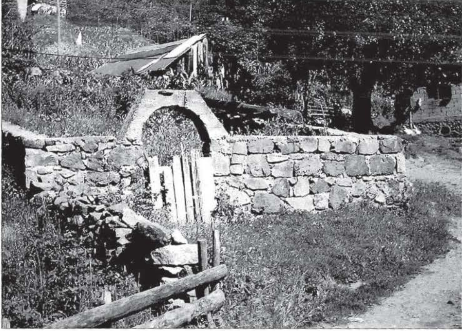
Kasım Dede İmarethanesi (Düvar İçinde)