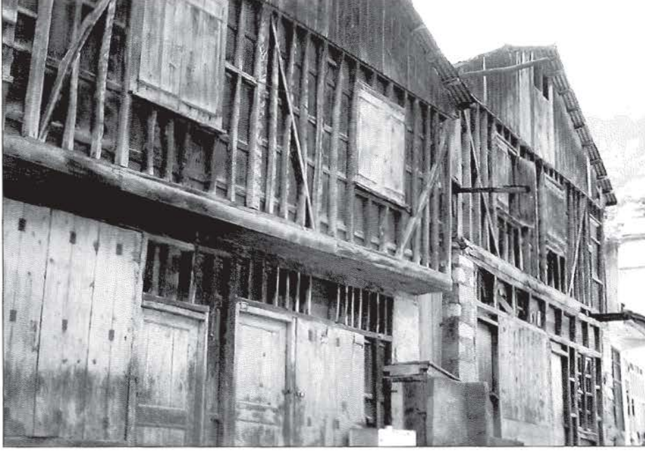
Y. Boynuyoğun (Tekke) Köyü'nün Merkezindeki Tarihi Hanlar (Derbent Kalıntısı)