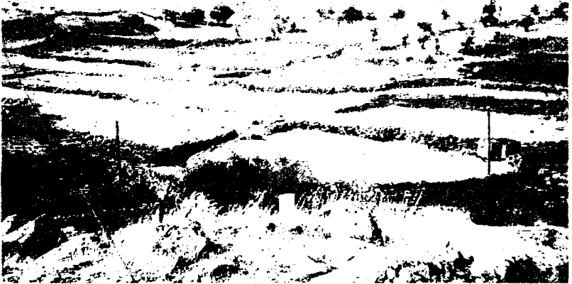
Kurbanların kesildiği yer