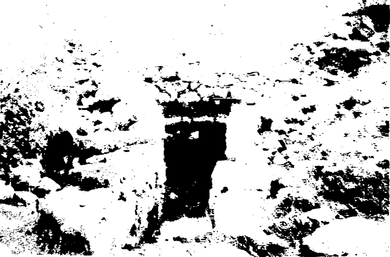
Taşların atıldığı kuyu