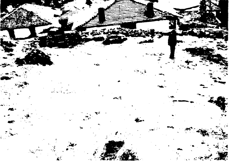
Kurbanların kesildiği yer