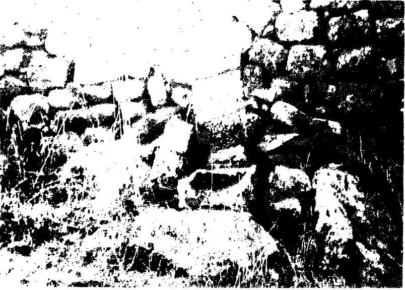
Yatırın uzaktan görünümü