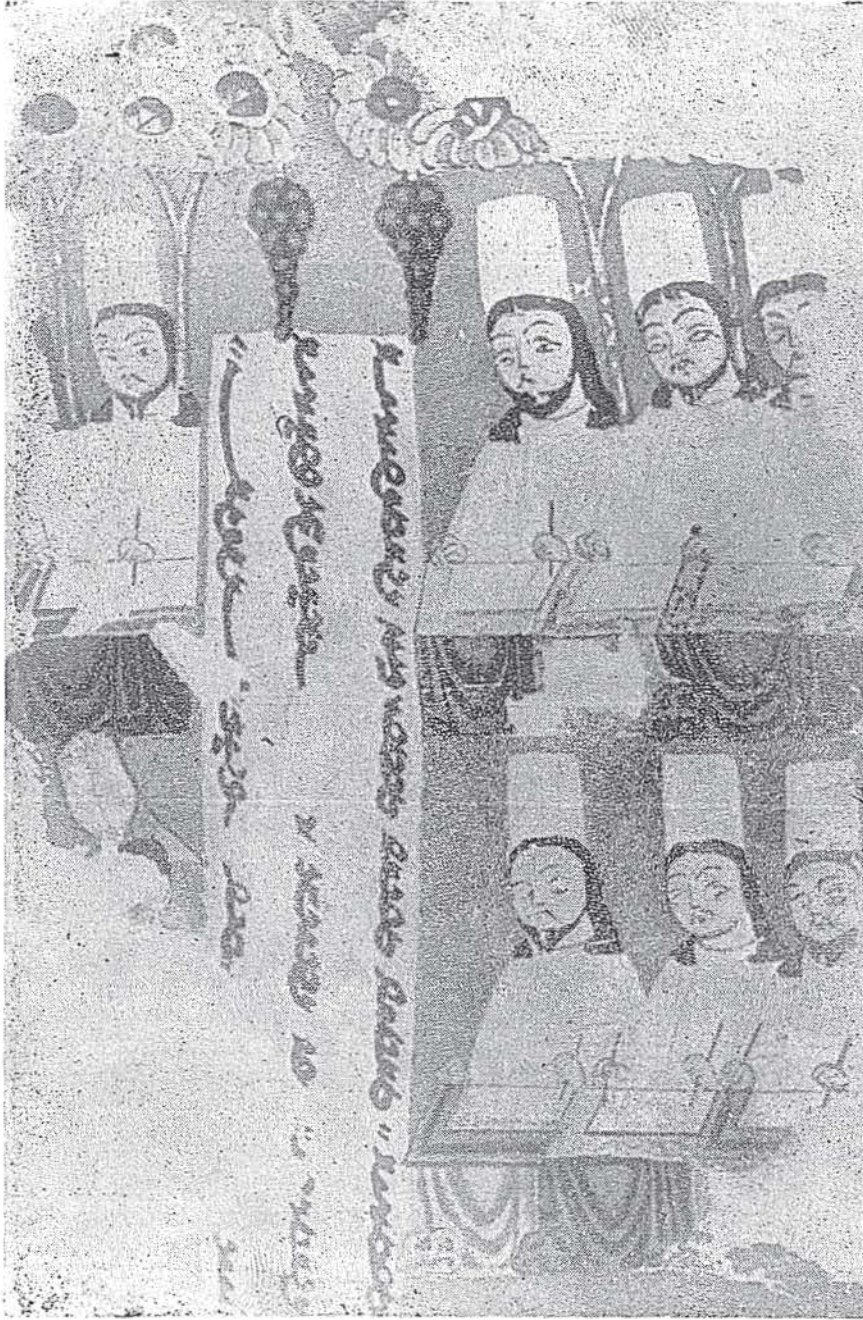
Doğu-Türkistan Uyghur Minyatürü, 9. asır