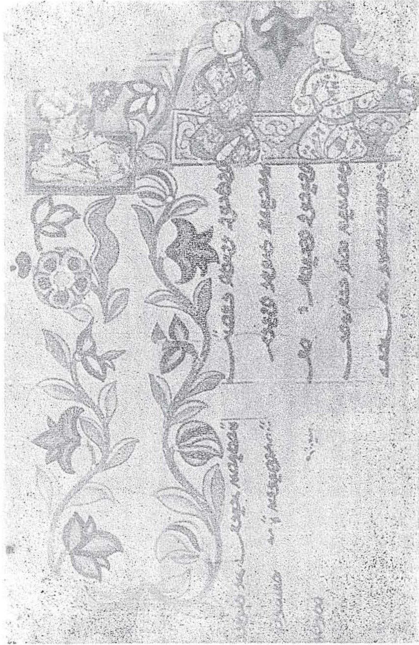
Doğu-Türkistan Uygur Minyatürü, 9. asır