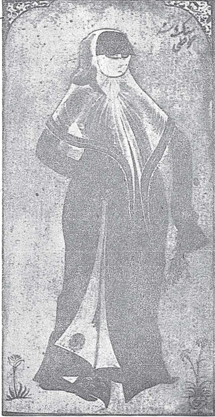
Feraceli kadın 18. asrın ilk yarısı, Osmanlı