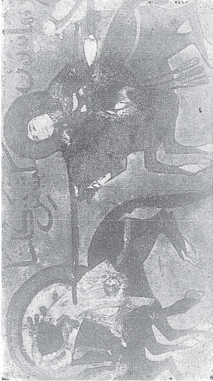
Varika ve Gülşah, 18. asır Selçuk