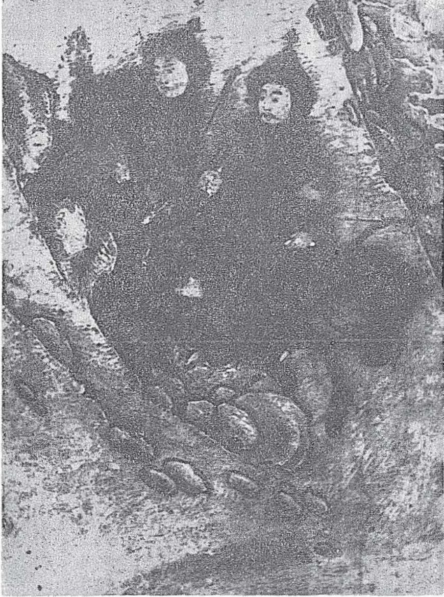
Karda av (detay) Fatih Albümü H. 2153