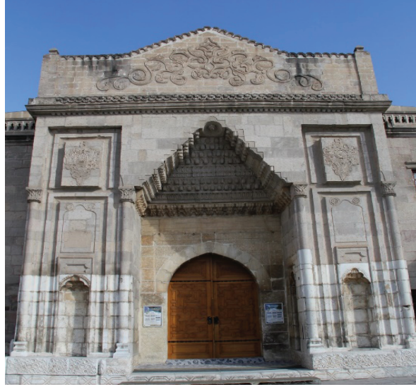
Foto. 2: Ulu Camii'nin ana giriş kapısı

köşesinde aydınlatma işlerinde kullanılan bezir, zeytinyađı ve caminin çeşitli eşyalarının konulduđu bir bezirhane bulunmaktadır. (Erdal vd. 2017: 100).