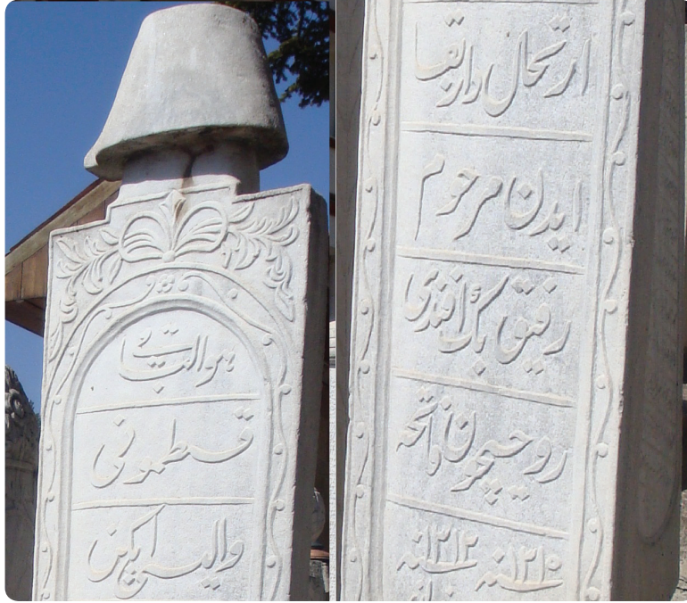
Resim 4. Şeyh Şaban Veli Külliyesi Haziresinde Metfun Bulunan Kastamonu Valisi Vefik Bey'in Mezar Taşı Kitabesi