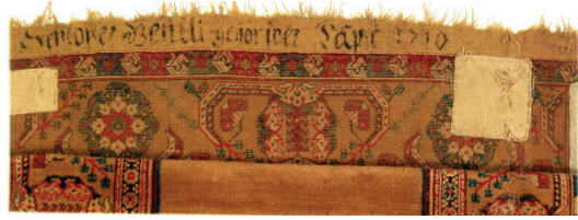
Fotoğraf 5. Bağış yazıtlı 5 Tek Nişli "Transilvanya" Tipi Halı (Ionescu 2005; 6)

Dindar ve halı satın alabilecek kadar varlıklı cemaat üyelerinin halılarını kiliseye getirme ve bağışlama davranışlarının özünde bir çeşit manevî ölümsüzlük arayışı olabileceği gibi gösteriş amaçlı bir hareket olabileceği de düşünülmektedir. Halıların kilise sıralarında kullanılmasının bir diğer amacı da, üzerlerindeki yazıtlarından o sıranın hangi aileye veya loncaya ait olduğunun belirtilmesidir (Ionescu 2007: 36). Fotoğraf 5'de görülen halı yazıtında geçen "Halı Demirciler Loncasına Aittir – 1710" ifadesi bu hususta önemli bir kanıttır.