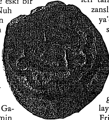
Karasioğlu Beylerbeyi Çelebi'ye ait bakır sikke

XIV. yüzyıl başında Batı Anadolu'nun Türk Beylikleri tarafından nasıl paylaşıldığını kaydeden Bizanslı tarihçi N. Gregoras'a 5 göre Lidya ve Eolya'dan başlayarak Helespont (Çanakkale) ile sınırlanan Misya topraklarında Kalames ve onun oğlu Karasis hüküm sürmekteydi. Kantakuzenos'un 6 eserinde ise Kalames 'in oğlu Karasis 'in hissesine Lidya'ya kadar olan Misya topraklarının düştüğü ve buraya Karasia denildiği belirtilmektedir. Geç devir Bizans tarihçilerinden Dukas'a 7 göre de Assos (Behramkale) şehrinden başlayarak ve Çanakkale'ye kadar uzanan Büyük Frigya, Karasi tarafından zapt edilmişti. Kalem Bey ile oğlu Karasi Bey muhtemelen 1296-1297 yıllarında Erdek, Biga, Edremit,