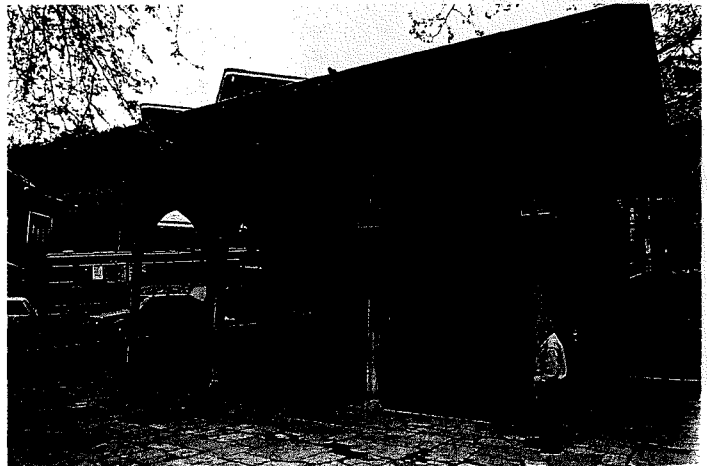
İshak Ağa Çeşmesi Enis Karakaya, 1994

8x6 m'lik dikdörtgen bir sahayı kaplayan bu anıtsal çeşmenin yüksekliği 4 m kadardır. Haznesine toplanan su, 10 tane bronzdan yapılmış lüle vasıtasıyla sürekli olarak akmaktadır. Bu on lüleden dolayı bu çeşme "Onçeşmeler" diye anılmaktadır. Lülelerden ortada yer alan iki tanesinin çapı, iki yanında yer alan dörder lüleden daha büyüktür. Lülelerin yer aldığı bu muhteşem cephe oldukça kaliteli, geniş mermer plakalarla kaplanmış, ortadaki iki lüle, dilimli bir kemere sahip olan sağır bir niş içine alınmıştır. Su sıg bir tekneye akmakta, buradan mermer zemine oyulmuş "T" şeklindeki dar bir kanalla dışarıya gönderilmektedir. Çeşme bu-