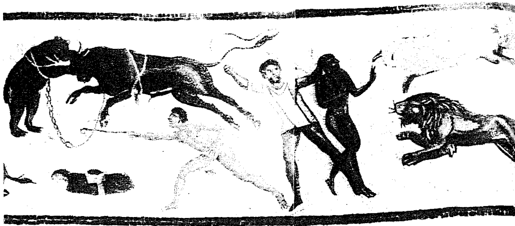
Condamné présenté aux africanæ , mosaïque de Zliten, Tripolitaine.

de la chasse trouvée à Hippone (Annaba). Des brebis et des chèvres placées dans un enclos servent d'appât tandis que des cavaliers rabattent dans un espace délimité par des filets et un véritable mur de chasseurs protégés par de grands boucliers agitant des torches enflammées. Ces rabatteurs poussent peu à peu les fauves vers une lourde cage dont la trappe est relevée. Cela ne va pas sans drame et l'on voit un malheureux terrassé par une panthère. La cage était ensuite juchée sur une charrette attelée à deux mulets. La même mosaïque présente dans un regroupement peu réaliste, car chaque espèce était chassée d'une façon particulière, la capture d'antilopes (vraisemblablement des oryx), de deux autruches et d'un âne sauvage au lasso.