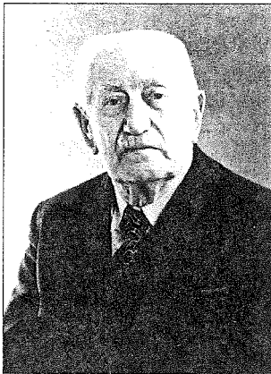
مطالعه درباره اسلام لاجاریک