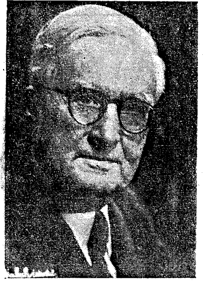
Merhum Üstad Sadettin AREL

Türk musikisindeki bestelerinin özelliği ise, batı üslubundan kuvvet almış olmaları ile melankoliden uzak, çok geçkili bir üslûp kullanılması ve bütün nüans işaretleri ile yazılmış olmalarıdır.