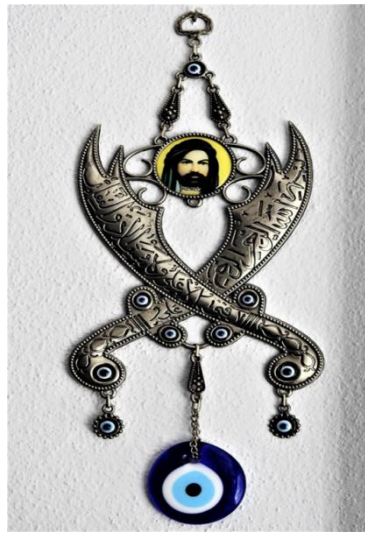
Foto 2: Üzerinde Hz. Ali'nin temsili resmini ve Zülfikar tasvirini barındıran bir nazarlığın görüntüsü

Zülfikar ile ilgili yaygın olan bir görüş de Hz. Muhammed, Zülfikar'ı Hz. Ali'ye hediye ettikten sonra, bu kılıcı kendisinin ölümünden sonra kullanmamasını söylemiş; o da Necef Vadisi'ne atmıştır. Bu sebeple Zülfikar'ın bugün nerede olduğu bilinmemektedir (Tokel, 2006, s. 329).