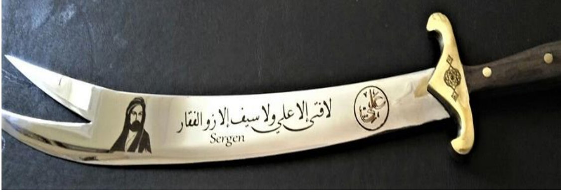
Foto 5: İnternette bir alışveriş sitesinde yer alan üzerinde Hz. Ali'nin resmi ve “lâ fetâ illa alî, lâ seyfe illâ Zülfikar” ifadesi bulunan bir kılıcın görüntüsü

Fetâ, Arapçada “yiğit”, “kahraman”; “seyfe” de “kılıç” anlamına gelmektedir. İllâ ise “yoktur” anlamındaki olumsuzluk kelimesidir.