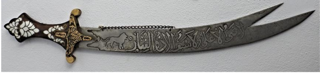
Foto 4: Üzerinde aslan tasviri ve “lâ fetâ illa alî, lâ seyfe illâ Zülfikar” ifadesi bulunan bir kılıcın görüntüsü

Hz. Ali, “Esedullâh” lakabının doğrudan bir tercümesi olan “Tanrı aslanı”, “Allah'ın aslanı” sıfatıyla zikredildiği gibi; Haydar lakabının Türkçe karşılığı olan “aslan” sıfatıyla da zikredilmektedir. Bu tercih de aslan kelimesinin Türkçede daima güç, cesaret gibi övgüye değer hususiyetleri hatıra getirmesi kadar Hz. Muhammed'in Miraç'ta Hz. Ali'yi “aslan” olarak zikretmesinin de rolü büyüktür.