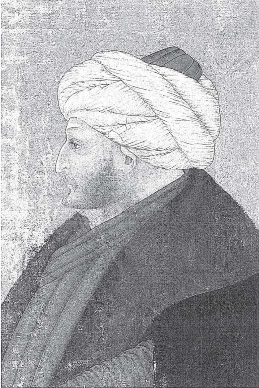
Fatih Sultan Mehmed'in Sinan Bey'e atfedilen portresi (TSMK, H. 2153, 145b)