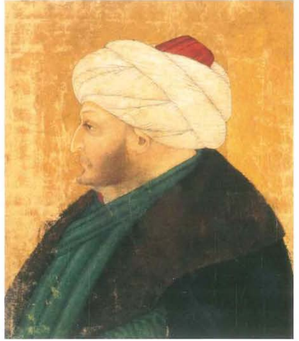
Fatih Sultan Mehmed (Sinan Bey)

Öte yandan Osmanlı hukukunun örfî esaslarının genel kanunnâmeler şeklinde yazılı metinler haline getirilmesi de bilindiği kadarıyla ilk defa Fatih döneminde gerçekleşmiştir. Özellikle ceza ve arazi hukuku ile malî hukuk alanında Osmanlı tebasının tâbi olduğu kuralların yazılı hale getirilmesi ve halkın bu esaslarla bilgilendirilmesi, bu kuralların belirgin ve biliniyor olmasının ötesinde kamu görevlilerinin (ehl-i örf) yetkilerinin kötüye kullanmalarının önüne geçmesi açısından da önemlidir.