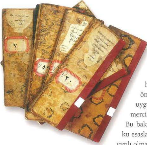
Şer'îye sicillerinden örnekler

Kamu görevlilerinin halka keyfi bir yönetim uygulamamaları ve özellikle malî açıdan yetkilerini kötüye kullanmamaları için iki önemli tedbir getirildiği söylenebilir. Birincisi kamu görevlilerinin vergi toplama, idarî ve cezaî tedbirleri uygulama gibi bütün tasarruflarının kadıların denetimi (kadı marifeti) altında yapılması, ikincisi de uygulanacak hukukî ve malî esasların kanunnâmeler halinde tespit edilip halka duyurulması. Bu tespit ve duyurulmanın önemi şuradadır ki kanunnâmelerde belirlenen esaslara aykırı bir uygulama ile karşılaşan Osmanlı insanı kadıya veya daha üst bir yargı merciine başvurup yapılan haksızlığı giderme imkanına sahip olmaktadır. Bu bakımdan Osmanlı hukukunun ana yapısını teşkil eden İslâm huku-ku esaslarının fıkıh kitaplarında, örfî hukuk esaslarının da kanunnâmelerde yazılı olması Osmanlı Devleti'nde bir tür kanun hâkimiyeti sağlamaktaydı. Bu, Osmanlı Devleti'nde adil bir yönetimin var olması açısından önemlidir. Fatih dönemine ait Kanunnâme-i Kitabet-i Vilayette: