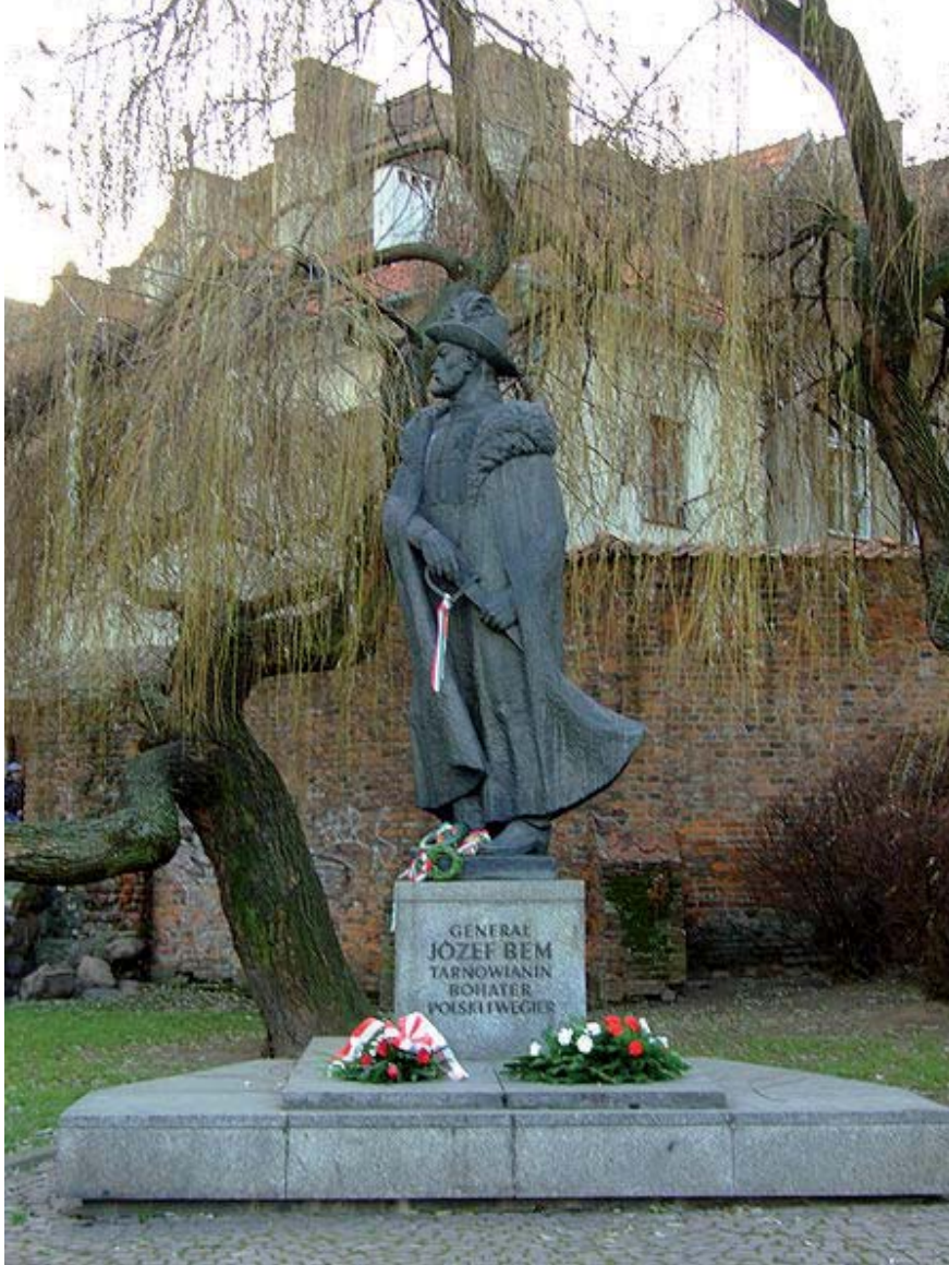
Ek 2-Jozef Bem'in menleketi Tarnow'daki heykeli.