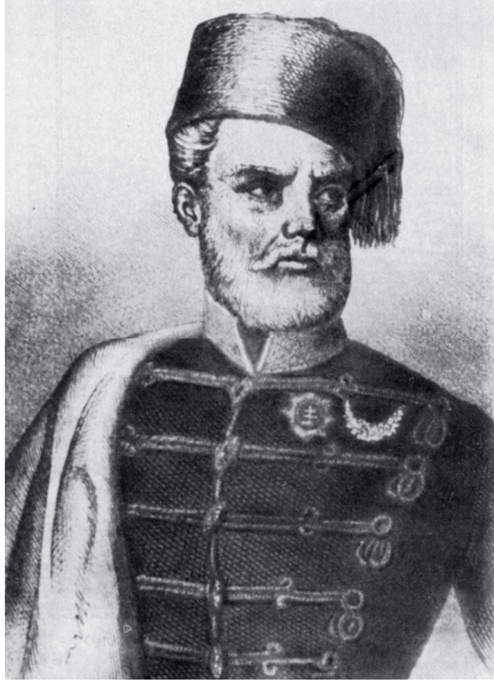
Ek 1- Murat Paşa / Jozef Bem, Osmanlı Üniforması ile