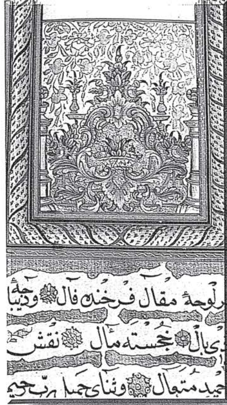
Beyhan Sultan'ın K.57 numaralı vakfiyesinin 7. zeylinin süslemesi

Müzehhibin kullandığı âletlerden bir de 'zermühre' denilen, ucunda yuvarlak ve cilâli bir akik bulunan âlettir. Bununla altın üzerine sürterek parlatılır ve böyle parlak yaldızlı işlere de 'pe-send' tâbir olunurdu.