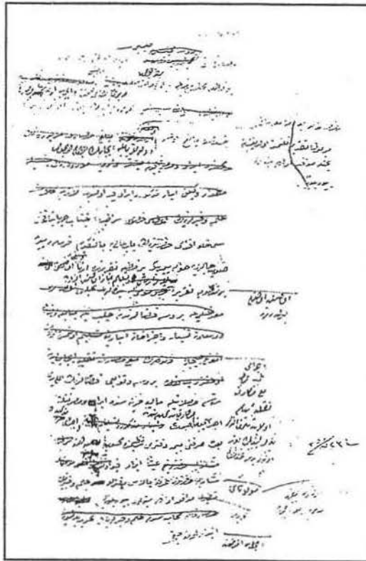
B.O.A. Cevdet Sıhhiye no: 776. 9.XI.1841 tarihli, gereken droğların Bursa dağlarından toplattırıldığını bildiren müsvettesi.

1841 yılına ait toplattırılan bu otların sarfını gösterir defterlerin de tanzim edileceği bildiriliyor 12 . Görüldüğü gibi Hekimbaşı ta-