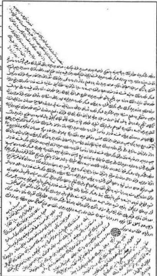
B.O.A. Cevdet Sıhhiye no: 419, belge no. 3. Meclise arz tezkiresi ve kırmızı mürekkep ile Meclisin ilaçları dağıtımını konusundaki görüşünü bildirir takrir.