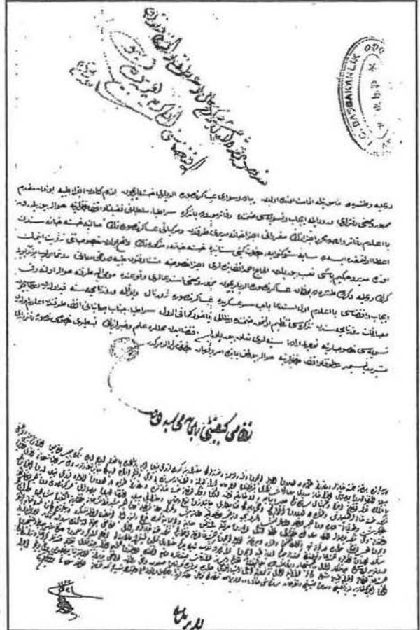
B.O.A. Cevdet Sıhhiye no: 419. belge no: I ve 2. Mayıs 1836 tarihli ilaç dağıtımını düzenlenmesi için verilen tahrirler.

Bu düzenleme ile ilgili başka bir belgede 6 ; 9 Mayıs 1835 tarihinde Mansure zimmeti defterine işlenen düzen şöyle; ilaçları imal edenler, listeleri yapıyor, fiyatları bildiriyorlar. Hekimbaşı onaylıyor, ispençiyar verdiği ilaçların listesini yapıyor ve fiyatlarını bildiriyor. Hekimbaşı ödeme yapılsın diye emir veriyor. Masarifat Nazırı parayı onaylıyor. İlaçların parası ödeniyor 6 .