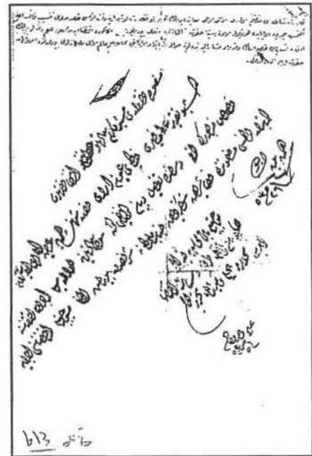
B.O.A. Cevdet Sıhhiye no: 419. belge no: 3 arkası Meclisin görüşünü bildirir yazı sonu (kırmızı mürekkep) ve Sadrazamın, padişahın iradesini bildirir buyruldu su

Padişahın emri: Mansure defterdarı bu takriri Padişah'a arzemiş 11 "..bu hususun beyan edildiği gibi tayin ve icrasına başlanılsın" diye Hatt-ı şerif yazılmış, Sadrazam da 2 Mayıs 1837 tarihinde "bu şekilde iktizasını icraya himmet deyu buyurdu" diye emir vermektedir. 11 Mayıs 1837 tarihinde de başmuhasebeye kaydıyla Hekimbaşı efendi, gelen yerlere ilmuhaberlerin yazıldığı kaydettirmiştir 11 .