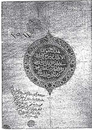
Şekil — 1

merakını ve bu örneklerin tenevvüründen ve vücutte getirilen nünelerin inceliğinden bu sanattan zevk aldığını ve tenevvüe de meraklı olduğunu anlıyoruz. Zira kendi kütüphanesi veya mütaleası için yazılmış olan ve eserin muellifini bildiren satırların etrafındaki nakışları nakkaş başka bir kitabede tekrar etmemiştir. Muayyen ve mahdud tezyinat malzemesile çoğaltılan ve mütenevvi' çizilen bu kitabelerin birbirine benzememesi hususundaki dikkat çok mühimdir (şekil 1,2).