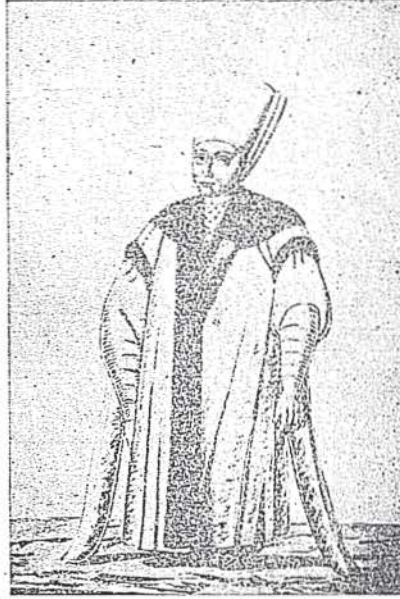
“ Resim 1 „ Kapı ağası

Bu hastahane teşkilâtını anlatan enderunlu müverrihlerden Apdullah bin İbrahim Üsküdarînin 1100 - 1106. 1694 - 1688 senelerine ait yazmış olduğu üç ciltten ibaret vakıyatında (*) sıra ile odaları anlatırken has oda ve seferli odalarından da bahsettiğine göre 923 - 1517 de Mısırın fethinden sonra emanatı mukaddeseyi getirdiği zaman has odayı ihdas eden Sultan Selim I ile 1015 - 1606 da Yeni sarayda seferli odasını ihdas eden Ahmet I tarafından enderun hastanesinde mezkûr odalar için de daireler ilâve edildiği anlaşılmaktadır.