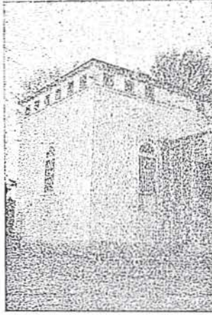
“Resim 4,, Hekim başı odası

Bu muvakkat tedbire ait ilâçlar iktiza ettikçe kiler hassa odası kethüdası tarafından tanzim edilen listeye bağı bir senedle ve reisül-etibbanın (hekim başı) tasdikinden geçmek suretile alınıp mezkûr ecza dolabına konulur. Ve kullanıldıkça eksik kalan ilâçlar yine aynı merasimle ikmal edilip yerine konulur idi. (1)