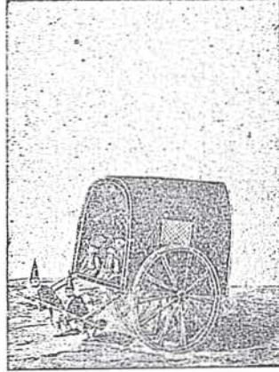
« Resim 2,, Hasta arabas

«Araba» sesini işiten nöbetçi «bevvaban» da hastalar için mahsus yeri olan odun anbarına (1) giderek acem oğlanları namı altında bulunan hizmetkârların bölük başısına araba istendiğini söyler. İki tekerlekli ve üstü kırmızı çuha örtülü olan bu hasta arabası (2) (resim 2) acemi oğlanlarının nöbeçilerinden iki nefer çekerek babüsseadenin sakafında mermer direkler yakınına getirirler. Ve arabanın geldiği hastanın mensup olduğu odaya bildirilir.