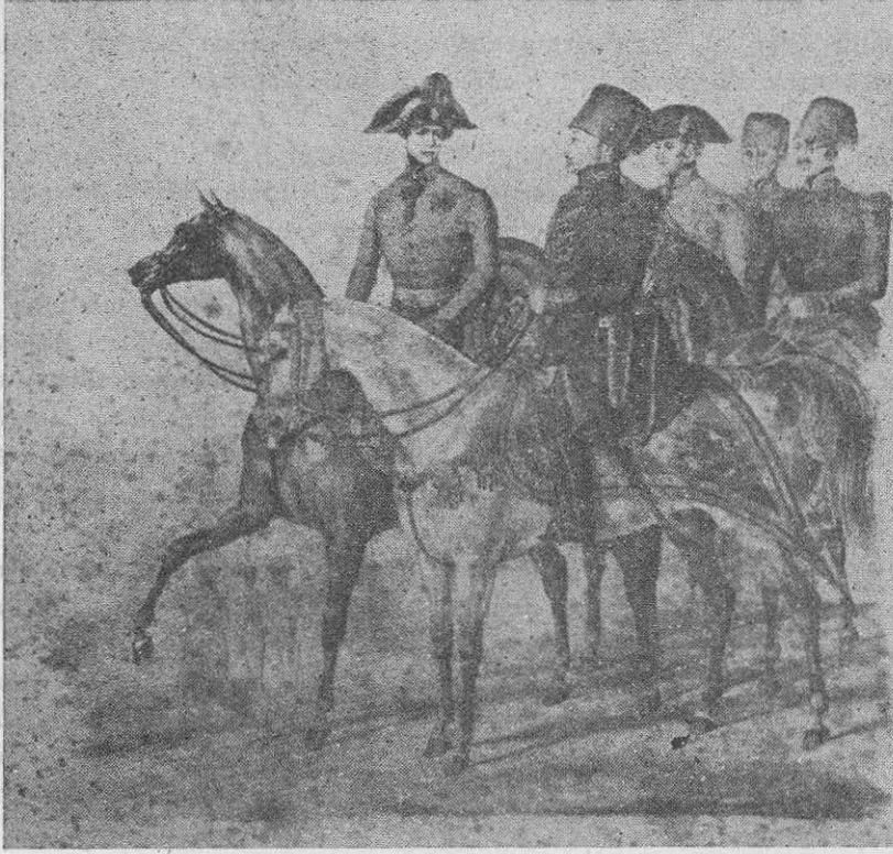
Ahmet Fethi Paşa Viyana sefiri iken (Gravür Topkapı Sarayı Müzesindedir No. 427)

1837 (1253 - Rebiulahır) iptidalarında uhdesine Paris Sefareti ile beraber Aydın Eyaleti verilmiş, bir ay kadar Aydında bulunduktan sonra