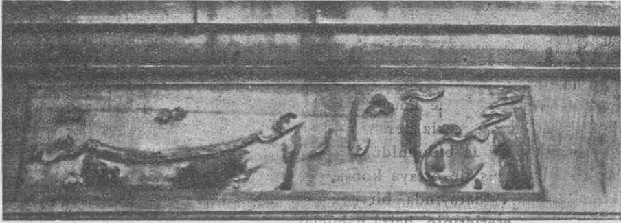
Cebahanede (St. Iréne) kurulan müzelerin kitabeleri

lüğünü tebarüz ettiriyor. Buda, Paşanın hal tercümesi incelendikçe, pek güzel anlaşılıyor.