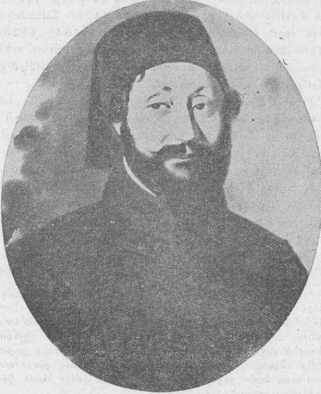
Ahmet Fethi Paşa

Ahmet Fethi Paşa, [1] Paris ve Viyana sefaretlerinde uzun yıllar kalmış Londra ve Moskova'da bulunmuş olduğundan bu memleketlerin san'at ve kültür hareketlerini benimsemiş ve memleketinde bunların tatbiki için her imkândan istifade etmiş, Müsteşarı Saltanat mevkiini kazanmış [2] bulunmakla da fikirlerini hükümdara ve alâkalılara kolayca kabul ettirebilmiştir.