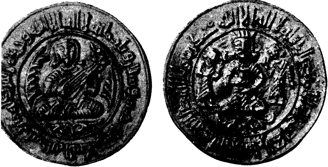
Etnoğrafya müzesindeki Altın Ettayi lillâh madalyası (iki misli büyütülmüş)

Buye oğullarından Muizzüddeve Ahmet hicretin 334 üncü yılı cemaziyevvelinde (945 Birincikânun M.) Bağdadı amlış bundan sonra da Bağdat