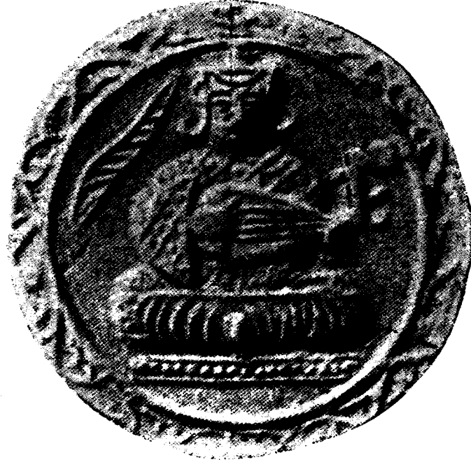
Berlin müzesindeki Elmuktedir billâh madalyası (büyütülmüş resmi)