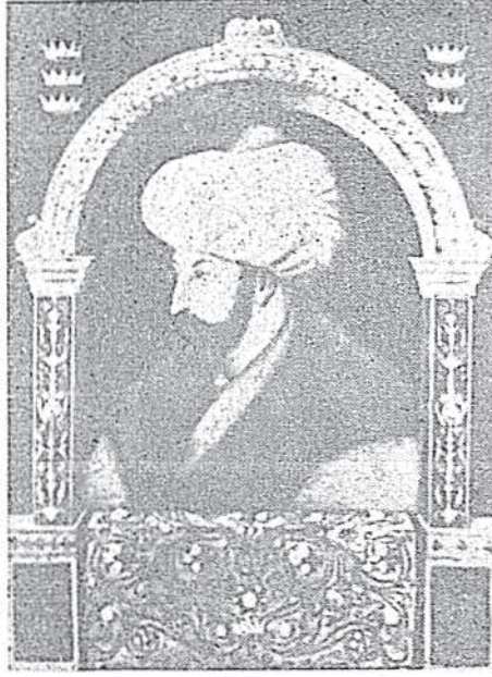
Fatih'in Gentile Bellini tarafından yapılan ve bugün Londra'daki National Galery'de bulunan meşhur resmi

rika'da, birçok ilâvelerle, genişletilmiş olarak, iki cilt halinde yayınlanacak kitabımın ikinci cildinde, Almanya'da yapılacak ikinci baskıya paralel olarak, dünya efkârına, iki yepyeni Fatih resmi takdim etmek bahtiyarlığına erişeceğim. Her iki resmin de Gentile Bellini'nin fırçasından çıkmış olduğunda bütün batılı sanat uzmanları birleşmektedir. Hayat mecmuasının bu resimleri dünyada ilk defa, renkli olarak basıp, Türk okuyucusuna tanıtmasını ben şahsen büyük bir memnunlukla karşılıyorum. Aşağıda sözünü edeceğim «İkili» portreyi Venedik'te yayınlanan Arte Veneta mecmuası XV. cildinde pek yakında, gene Hayat mecmuası ile aynı tarihlerde neşreder.