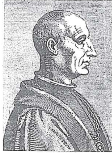
Ressam Gentile Bellini