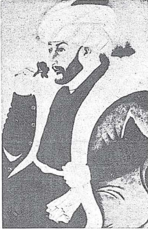
Fatih Sultan Mehmed Han

Aslında Fatih II. Sultan Mehmed Han'ın annesi Türk'dür. Bütün eski Osmanlı kaynakları onun Candaroğlu İsmail Bey'in kızı Halime Hatun olduğunu kaydederler. Ancak son araştırmalar Fatih'in annesinin İsfendiyar Bey'in değil, oğlu İbrahim Bey'in kızı olduğu ve Hadice Hatun diye anıldığı iddiasını ortaya atmıştır. Ahmed Tevhid Bey merhum XVI. yüzyıl başı tarihli bir vakfiyeye dayanarak Fatih'in annesinin Kaplıca'daki türbede gömülü İbrahim Bey'in kızı Hadice Hatun olduğunu ileri sürmüştür. Diğer bir rivayete göre de, bu bahtiyar kadın Dulkadiroğulları hânedanından Alime Hatun'dur. Bursa şer'î mahkemesi sicillerinin verdiği bilgi ise başka türdür ve Fatih'in annesini Hüma Hatun olarak gösterir. Türbesi Bursa'da Muradiye Camii'nin doğu tarafında, yüz metre mesafededir ve Bursahlılar tarafından Hattuniye türbesi diye anılmaktadır. Kitâbe-