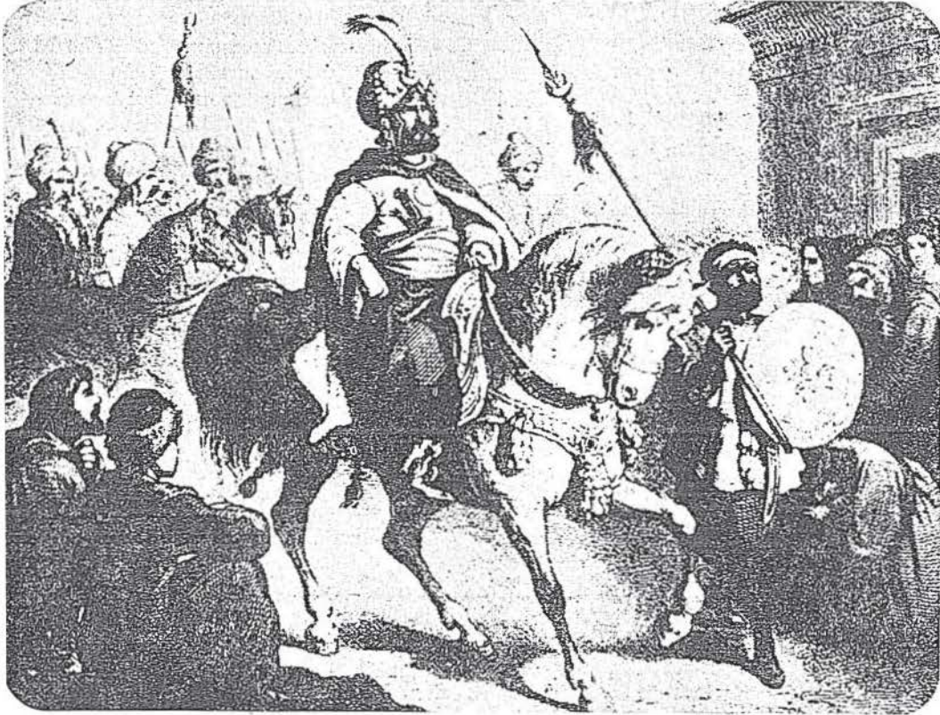
Fatih Sultan Mehmed'in İstanbul'a girişini gösteren Batı kaynaklı bir resim.

— İşte Saadetlü baban Manisa'ya gider. Askerin hali malûm... Şimdi lâzım ki siz dahi mübarek ellerini öpüp Padişahlıkta kalmalarını dileyesiniz. Bunu asla kabul etmezler ve yine giderler ama, hem asker o taraftan ümidi kalmayıp fitne def olur, hem babanızın hâtır-ı şerifi alınır.