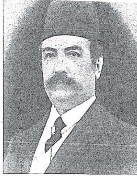
Damad Ferid Paşa.

Bu iş sona erince, bekleyiş başladı. Sâ-dık adamları bütün gece efendilerini avu-tarak heyecanını hafifletmeye çalıştılar.