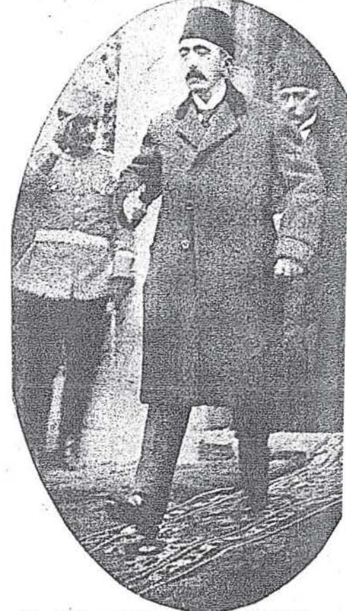
VI. Mehmed Vahideddin veliahd iken.