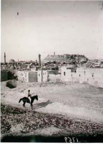
Halep, şehrin uzaktan görünümü, 20. yüzyıl başları.