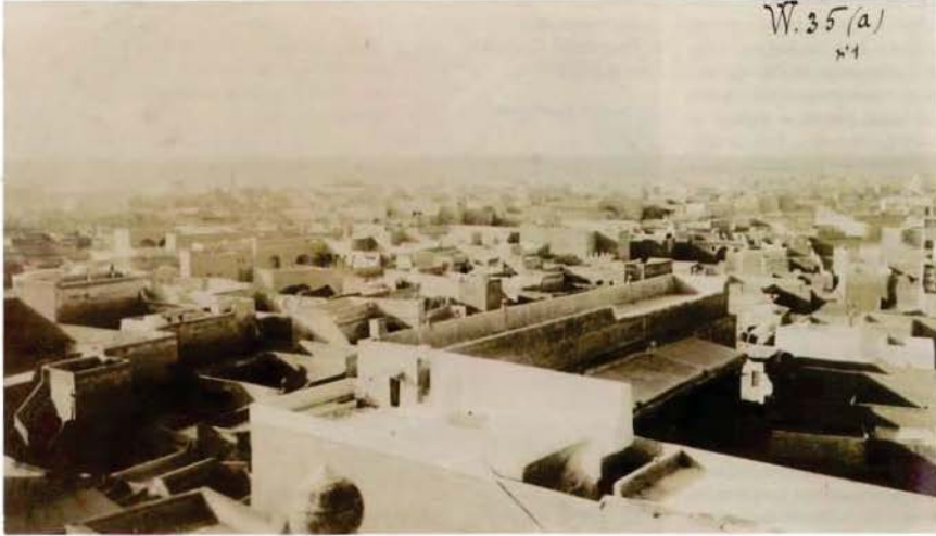
Halil Ramî'nin 12 Nisan 1912'de tayin edildiği Musul'dan görünüm.