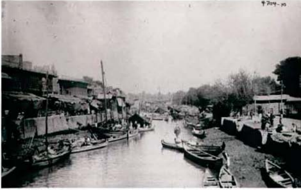
Bagdat, Dicle Nehri.