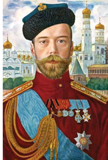
Reval'de buluşan VII. Edward ile II. Nikolay'ın Makedonya sorununu görüşmeleri Jön Türkler arasında bomba etkisi yapar.