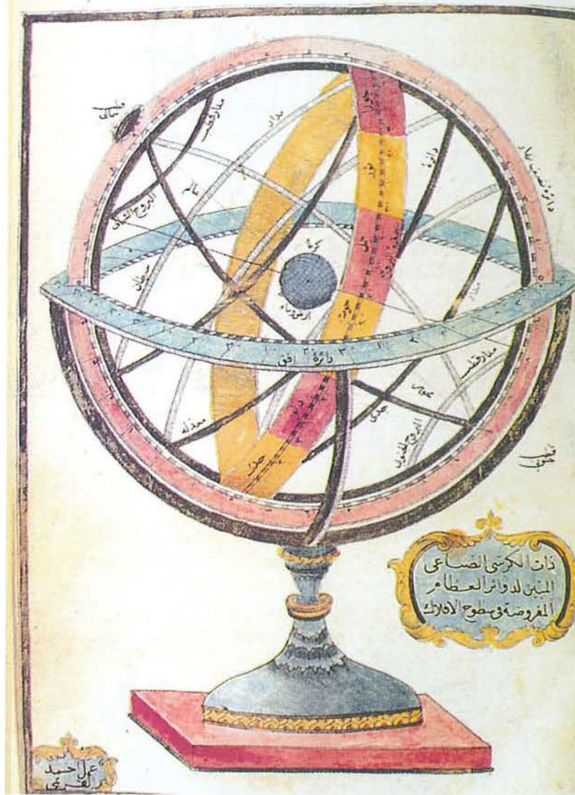
Kitâb-ı Cihânnümâ, Zatü'l Kürsî. Yazmadan Basmaya: Müteferrika, Mühendishane, Üsküdar, İstanbul, YKY, 1996

Matbaada basmış olduğu kitaplardan satılmamış olarak elinde kalanlar ise ayrı bir tasnife tâbi tutulmuştur. Bu kitaplar yine Sultan Selim Câmîi ittisalinde Tophane mahallindeki kârgir bir depoda muhafaza edilmektedir. Bunlar, Ferbeng-i Şu'urî (409 adet), Naima Taribi (112 adet), Raşid Taribi (306 adet), Cibânnümâ (249 adet), Takvimü't Tevarih (226 adet), Gülşen-i Hülefa (235 adet), Târîb-i Mısır , Târîb-i Seyyâb , Târîb-i Timur ve Târîb-i Hind-i Garbî , Tühfetü'l-Kibar , (hepsi toplam 1114 adet), Usûlü'l-Hikem , Füyuzat-ı Mıknatışiyye , Abvâl-i Gazavât der Dîyâr-ı Bosna (toplam 240 adet), Holdermann'ın Gramatika'sı (84 adet), Van Kulu Lügatı (1 adet). Ayrıca eserlerin fiyatları verilmiş ve toplam değerleri hesaplanmıştır. Van Kulu ise tamamen tükenmiştir. Böylece, Müteferrika'nın halefi Kadı İbrahim'in bastığı tek eserin de yine Van Kulu olmasının sebebi daha iyi anlaşılabilir. Basılan kitapların bu oranlarda elde kalmış olmasına rağmen satış işinin iyi gittiğini söylemek mümkünse de, basım adetlerinin azlığı dikkate alındığında bunun pek de parlak bir sonuç olmadığı açıktır. Mesela 500 adet basılan Cibânnümâ 'dan ancak 224 tane satılmıştır. Dikkati çeken ikinci husus basma kitapların, matbaanın kuruluş gerekçesindeki savın aksine pahalı olduğudur. Talep kıtlığı ve basılan eserlerin genelde elde kalması, dolayısıyla yatırılan sermayenin geri gelmemesi halinin Mühendishane ve Üsküdar Matbaaları için de söz konusu olduğu bilinmek-