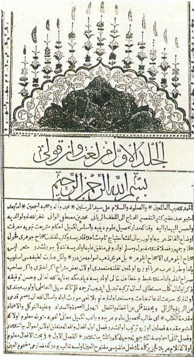
Vankulu Lügati, cilt 1, ilk sayfa. Yazmadan Basmaya: Müteferrika, Mühendishane, Üsküdar, İstanbul, YKY, 1996

ra çıkan ayaklanma sonucunda, sefere çıkmakta ayak sürten Sadrazam Nevşehirli İbrahim Paşa öldürülecek (1 Ekim 1730) ve ertesi gün de III. Ahmed tahtından indirilecektir.