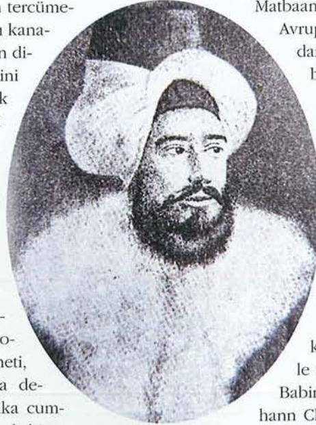
İbrahim Müteferrika Osmanlılar Ansiklopedisi, İstanbul: YKY, 1999, c. 1, s. 631

Matbaanın kurulması ve faaliyete geçmesinin Avrupa'da özellikle şarkiyatçılar tarafından yakından izlenmiş olduğunu Babinger göstermektedir. (s. 52 vd). Hollanda devlet arşivinde bulunan ve Babinger'in eserine tıpkı basım ve Türkçe tercümesi verilme suretiyle ilave edilen “Origio et Principium Typographia Otthomanica” (Osmanlı Matbaasının Kuruluşu ve Başlangıcı) başlıklı Latince bir belge, bu tür malzemelerin mevcudiyetine işaret etmektedir. Bonnaval'e ait olduğu bilinen yazışmalar yanında, 26 İbrahim Müteferrika'nın da yurtdışındaki bazı çevrelerle mektuplaştığı bilinmektedir. Mesela, Babinger'in de belirttiği gibi, şarkiyatçı Johann Christopher Clodius bunlardan biridir. (s. 55). Clodius'un matbaaya olan ilgisi sebebiyle İstanbul'dan, “meraklı ve âlim biri”, kendisine Târîb-i Seyyâb 'tan yapmış olduğu çeviriyi yollar. (1731). Bu ifadeyle kastedilen