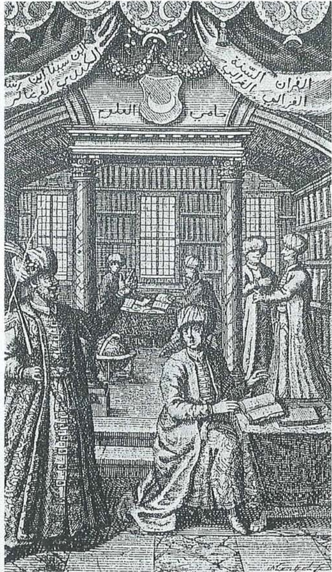
Müteferrika'nın mektuplaştığı şarkiyatçı Clodius'un Latince-Türkçe-Almanca lughatı. Leipzig 1730.

Müteferrika, 1710'da yazdığı ve Muhammed Peygamber ve ümmeti hakkında eski mukaddes kitaplarda yer alan Tebşirat meselesini ele alarak yazdığı Risale-i İslâmiyye adlı eserinde, kendisi hakkında az da olsa önemli bilgiler vermiş olmakla beraber, bunlar Babinger tarafından değerlendirilmemiştir. 9 Burada Müteferrika, Kolojvarlı (Erdel) olduğunu, küçük yaştan beri Tevrat ve İncil ve Zebur okuduğunu ve eğitimini tamamlayarak "va'z ve nasihat ile me'mur" olduğunu, hocalarının itibar etmediği kadim Tevrat parçalarını gizlice incelediğini ve Tebşirat konusunda tartışmalarda bulunduğunu ifade etmektedir. Müteferrika bu eserinde Tevrat'tan Latince olarak pek çok alıntılar yapmakta, ayrıca bunların yerlerini göstermekte ve bu Latince alıntılarını, okunuşunu esas alarak Arap harfleriyle yazılmış olarak vermektedir. Kendi ifadesiyle Latince bildiği kesinlik kazanan