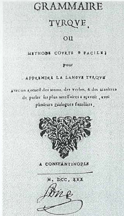
Müteferrika'nın bastığı Holdermann'ın gramatik kitabından ilk sayfa. İstanbul 1730.

Târîb-i Seyyâb 18 hakkında Babinger'in yaptığı açıklamalar ilgi çekici başka bir meseleyi gündeme getirmektedir. Afganlılarla İran arasındaki savaşı ve Safevî hanedanının çöküşünü ele alan bu eser, 25 seneden fazla İran'da bulunan Polonyalı Cizvit misyoneri Judas Thaddäus Krusinsky (1675-1756) tarafından Latince olarak kaleme alınmıştır. Krusinsky, 1728'de İran elçisi Mehmed Han'la birlikte İstanbul'a gelmiştir. Târîb-i Seyyâb 'i 1740'da Latince olarak bastıran Krusinsky, İstanbul'da, daha henüz ülkesine dönmeden önce Sadrazam Nevşehirli İbrahim Paşa'nın isteği üzerine eserini Türkçe'ye çevirmiş olduğunu beyan etmekte ve bu iddiası dönemin mu'teber diğer bazı şarkiyatçıları tarafından doğrulanmaktadır. Öte yandan Müteferrika da, 1729'da Türkçe olarak bastığı eserin daha ilk sayfalarında, Türkçe tercümenin bizzat kendisi tarafından yapılmış olduğunu açıkça belirtmiş bulunmaktadır. 19 Müteferrika'nın Latince bildiğinden şüphe duyan ve “aslında hâkim olmadığı kesin olan bir dilden, bu eseri nasıl Türkçe'ye çevirmiş olduğunu anla-