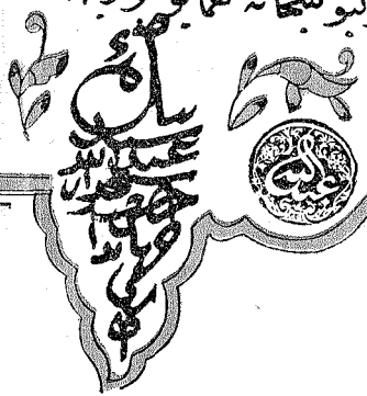
Silâhdar-ı şehriârî Seyit Abdullah Ağanın telhisi üzerine Topkapı Sarayı Müzesindeki kütüpanelerin korunması hakkında Selim III. ün bir hat-tı hümayunu

(Topkapı Sarayı Müzesi, yeni kütüpane, No. 26)