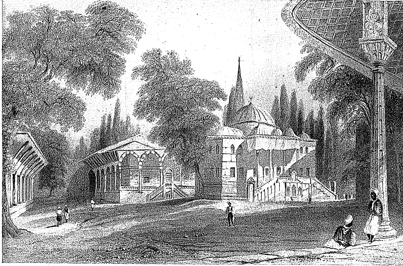
Topkapı Sarayı Enderun meydanını gösteren işbu gravürde (Üçüncü yeri) Sağda Seferli koğuşu, Ortada Ahmed III. kütüphanesi, arkada Arzodası görülmektedir. ( The Bosphorus & The Danube, William Beattie, 1839 )