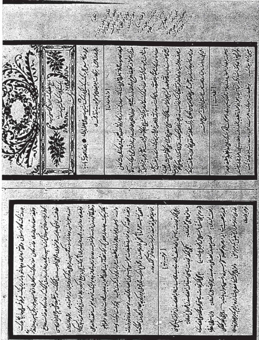
Resim 7 — Ahmed Lûtfi Efendi tarihinin on ikinci cildi baş sâhifesi.