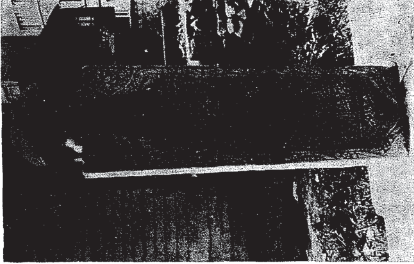
Resim 2 — Ahmed Lütfi Efendi'nin mezar kitâbesi.