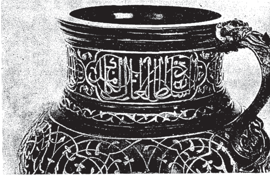
Şekil 2 — Sulûs hattı ile boyun yazısının ilk kısmı (السلطان العادل الكامل)