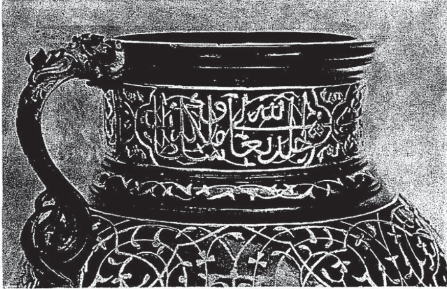
Şekil 5 — Sülüs hattı ile boyun yazısının dördüncü kısmı (خلد الله تعالى ملكه وسلطانه)