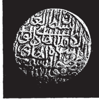
Şekil 10 — Şah İsmail'e âit (9 nolu) sikkenin diğer yüzü (Tehran, İran Bastan müzesi).