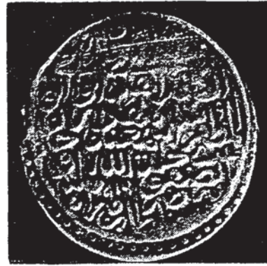
Şekil 8 — Şah İsmail'e âit (7 nolu) sikkenin diğer yüzü (Tehran, İran Bastan müzesi).