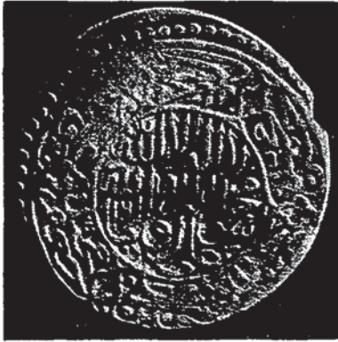
Şekil 7 — Şah İsmail'e âit bir sikke (Tehran, İran Bastan müzesi).