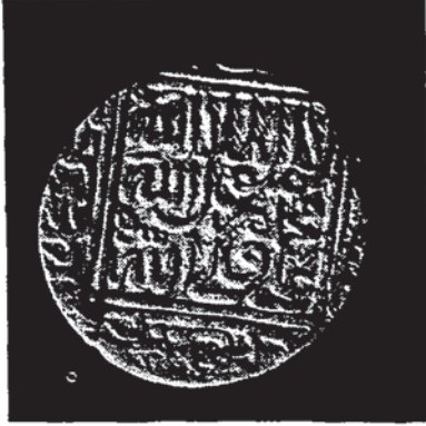
Şekil 9 — Şah İsmail'e âit bir sikke (Tehran, İran Bastan müzesi).