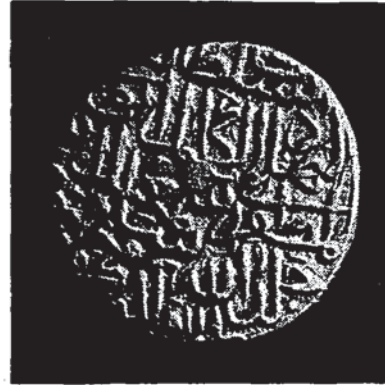
Şekil 12 — Şah İsmail'e âit (11 nolu) sikkenin diğer yüzü (Tehran, İran Bastan müzesi).