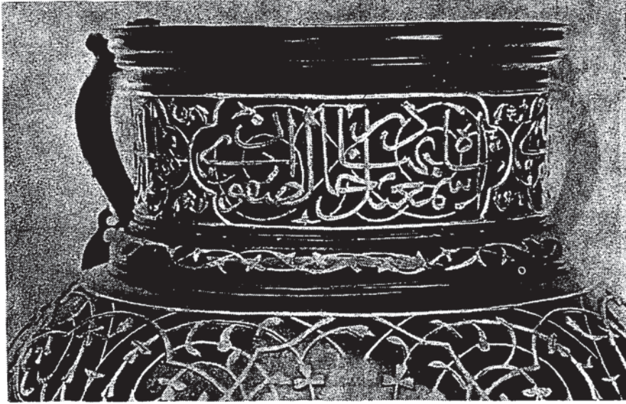
Şekil 4 — Sülüs hattı ile boyun yazısının üçüncü kısmı (شاه اسمعیل بهادر خان الصفوی)