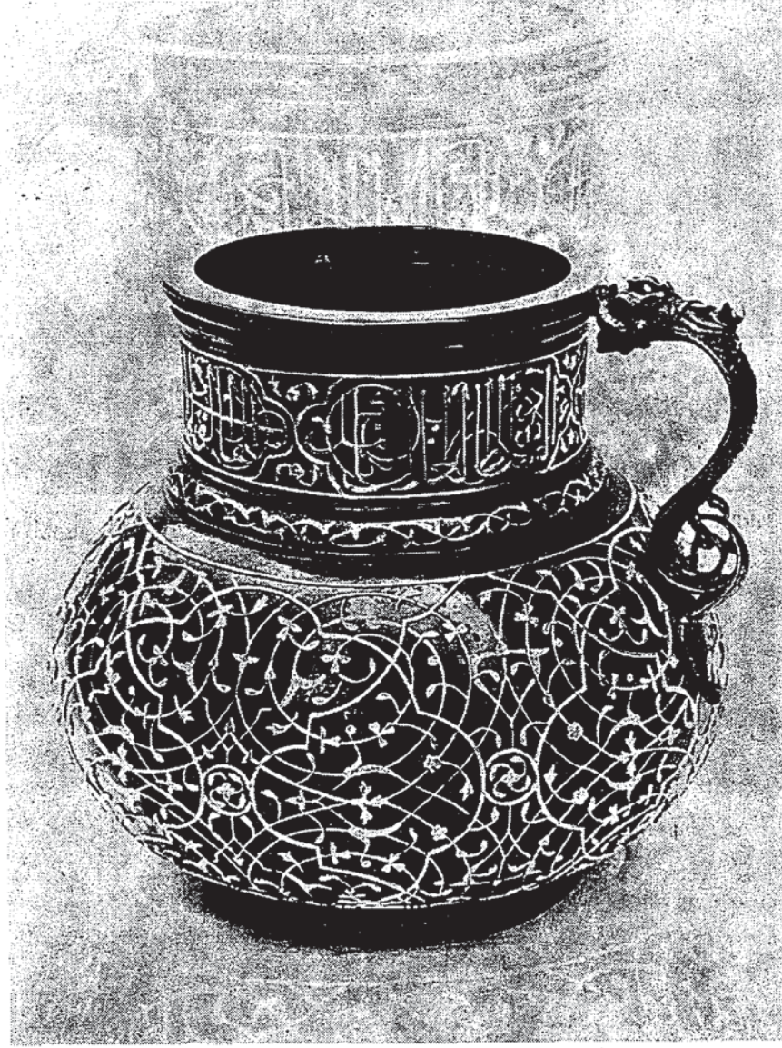
Şekil 1 — İstanbul, Topkapı Sarayı'nda bulunan Şah İsmail-i Safaviye âit kupa.