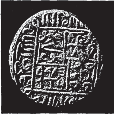
Şekil 11 — Şah İsmail'e âit bir sikkenin bir yüzü (Tehran, İran Bastan müzesi).