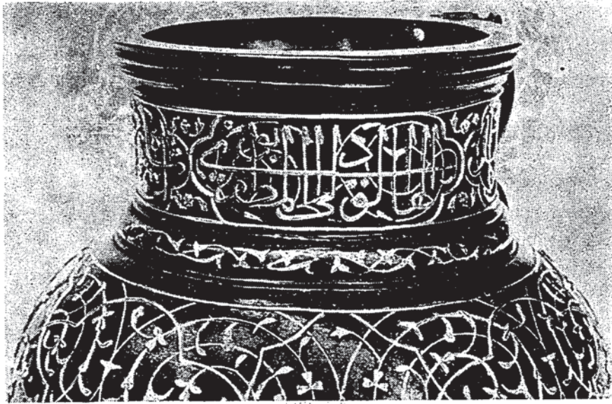
Şekil 3 — Sulûs hattı ile boyun yazısının ikinci kısmı (الهادى الوالى ابو المظفر)